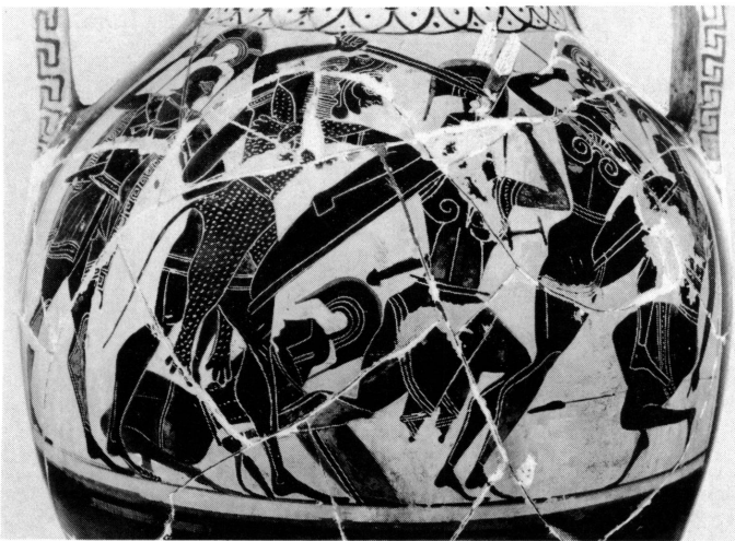
6. Amphore de Paris, Musée du Louvre E 733.

à Lindos 5 , où l'on reconnaît des plumes parmi d'autres ornements de casque (cornes et oreilles).