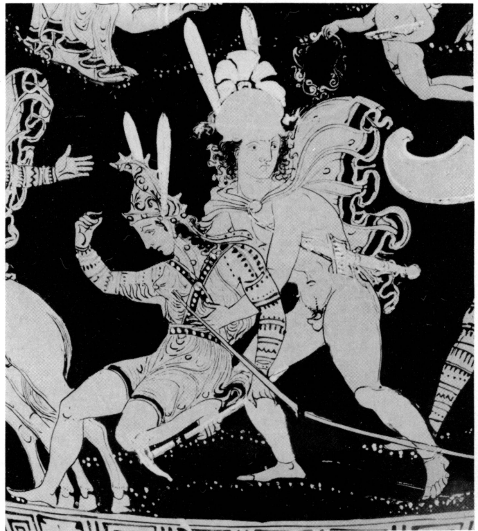
8. Cratère apulien de Genève, collection privée.

N.B. Cet article était sous presse quand j'ai eu connaissance de l'ouvrage de P. DINTSIS, Hellenistische Helme (Archeologica n° 43), 1986.