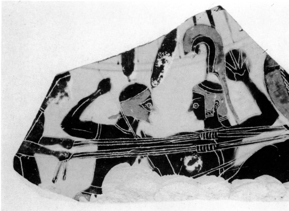
3. Fragment d'une amphore attique, Bâle, collection Herbert Cahn.