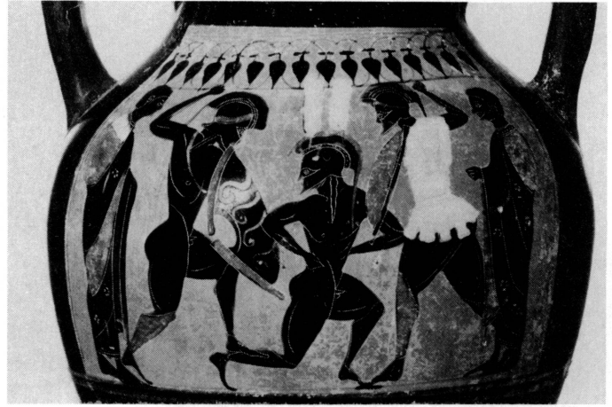
7. Amphore (face B) de Malibu, J. Paul Getty Museum (prêt Walter Bareiss).

A l'époque où le peintre de Darius créait le cratère des Funérailles de Patrocle, Alexandre le Grand, à la bataille du Granique (334 avant J.-C.), arborait un casque à panache «de chaque côté duquel se dressait une plume d'une grandeur et d'une blancheur remarquables» 17 . On voit Alexandre ainsi coiffé sur une monnaie dite de Pôros (frappée à Babylone soit par le souverain lui-même après son retour des Indes, soit par Perdicos en 223/222) 18 . Il est probable qu'Alexandre, en adoptant une coutume abandonnée depuis longtemps, ait voulu frapper l'imagination de ses contemporains. Ces grandes plumes l'assimilaient à un Géant et répandaient la terreur.