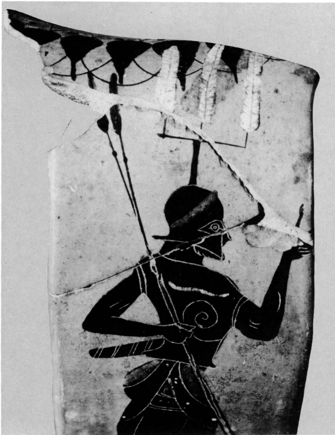
4. Fragment (anse) d'une amphore nicosthénienne de Bruxelles, Musée du Cinquantenaire R 331.

tache noire ou rouge à la base, cette tache correspondant au duvet. Il faut probablement reconnaître des plumes d'aigle, oiseau réputé hardi et féroce. Les plumes fines, telles qu'elles apparaissent sur le vase genevois, semblent d'une autre espèce, plumes de cygne ou plumes d'oie. Des plumes garnissent les diverses sortes de casques grecs, attiques, chalcidiens, ioniens et, surtout, corinthiens. Outre les doubles, on rencontre aussi les plumets simples ou triples. Quand la fixation de la plume est représentée, on devine qu'il s'agit d'un tube (douille ou étui 3 ) soit droit, soit en ligne brisée. Le point d'ancrage de la fixation se situe, généralement, à la base du casque, à l'échancrure latérale. Le tube droit et le tube coudé peuvent coexister sur le même casque. L'inclinaison des plumets varie, mais ceux-ci dépassent toujours nettement le casque. De tels appendices étaient, évidemment, encombrants et on doit supposer que le guerrier retirait la plume de son support lorsqu'il rangeait son casque. Je reproduis ici (fig. 1 et 2), dessinés au trait par S. Moddel, quelques types de casques à plumes, empruntés à des vases divers. Un fragment d'amphore, de la collection H. Cahn à Bâle, offre un autre bel exemple (fig. 3). Quant à l'amphore nicosthénienne (fragment) de Bruxelles 4 , elle montre le plus extravagant de tous ces casques: trois plumes sont fixées sur un haut support en forme de T (fig. 4)!