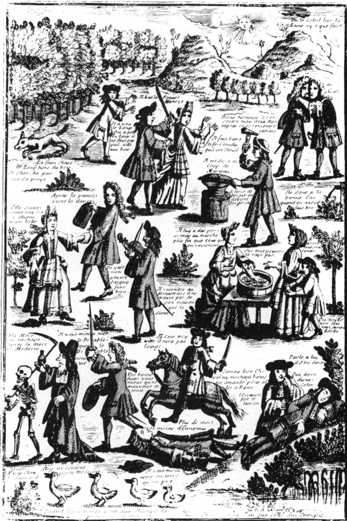
« DICTONS ET PROVERBES. » GRAVURE ANONYME DU DÉBUT DU XVIII e SIÈCLE.

3. Dictons et proverbes , gravure anonyme du début du XVIII e siècle. Extr. de: A. JAKOVSKY, Les proverbes vus par les peintres naïfs , Paris, 1973.