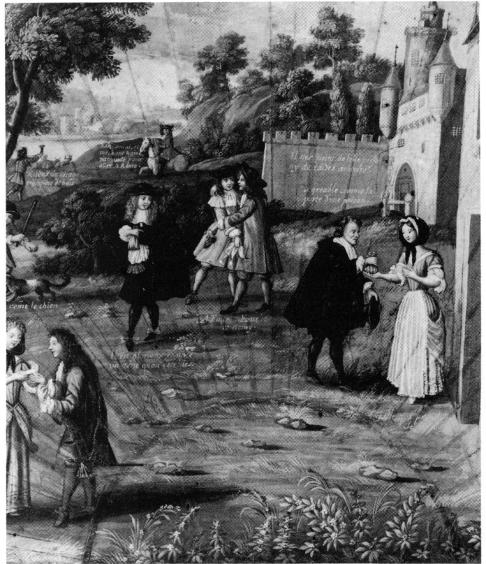
5. Détails centraux de la feuille d'éventail: Sentences et proverbes .

Un autre proverbe fait suite à celui-ci: agréable comme la porte d'une prison . Dans le Dictionnaire / comique / satyrique / critique / burlesque libre et proverbial de P.J. Le Roux, un Français réfugié à Amsterdam, on lit la locution suivante: «cela est charmant comme la porte d'une prison» 25 , locution proche de celle citée sur la feuille d'éventail, c'est-à-dire peu aimable, désagréable. Alfred de Musset qui s'intéressa aux proverbes, glisse dans ses Poésies nouvelles : «triste comme la porte d'une prison», dans son poème: Le mie prigioni 26 .