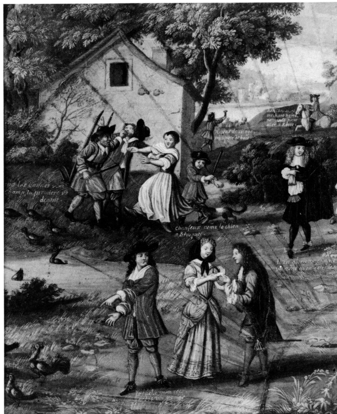
4. Détails gauches de la feuille d'éventail: Sentences et proverbes .

Pour renforcer cette idée de lutte et de désordre un nouveau proverbe est introduit (fig. 4): Chanceux comme le chien à Brusquet , illustré par un petit chien qui mord les jupes de la femme furibonde qu'il tente de tirer en arrière. Un petit garçon armé d'un bâton le frappe pour qu'il cesse ce manège. Brusquet est l'un des personnages proverbial bien connu, dont le chien fut mangé par les loups la première fois qu'il alla au bois. C'est Antoine Oudin, auteur des Curiositez / françoises [...] qui nous en donne une définition précise: « heureux comme le chien de Brusquet qui alla au bois, et le loup le mangea », c'est-à-dire mal fortuné 12 . On prononce donc ce proverbe à l'encontre d'une personne malchanceuse dans ses entreprises.