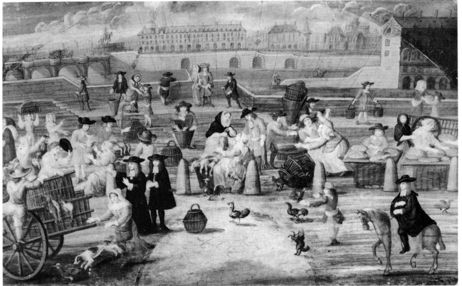
2. Anonyme, vers 1670 (?) Le marché à la volaille et le marché au pain quai des Grands Augustins . Gouache et rehauts d'or sur papier. Paris, Musée Carnavalet. Inv. D 7780.

proverbe dans sa formule d'origine. Et même, certains de ces proverbes ont été partiellement effacés avec le temps rendant difficile, voire impossible leur lecture. La syntaxe en est variable, la forme souvent elliptique, l'allitération dominante. A tout cet univers de mots vient se greffer une philosophie des plus satiriques, pâle reflet de toute une époque: celle raffinée et précieuse des courtisanes et des gentilshommes, mais aussi celle, plus rude et plus réaliste, des petites gens d'origine plus modeste. Le paraître côtoie l'être, l'oisiveté et la nécessité.