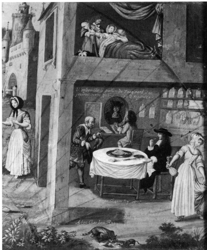
8. Détails droits de la feuille d'éventail: Sentences et proverbes .

A l'arrière fond de ce lieu (fig. 8), un greffier, une plume à la main, est assis devant son comptoir, des livres de comptes ouverts devant lui. Interpellé par un client dont le visage apparaît derrière une lucarne grillagée, il redresse la tête. Le proverbe correspondant à cette scène est: Il ressemble le greffier de Vaugirard, il ne sauroit écrire, quand on le regarde . Certains proverbes, comme celui-ci, ont vu le jour dans une région spécifique, une ville, un bourg ou une petite localité, et leur sens est indissociable de leur lieu de naissance. Vaugirard était ainsi une ancienne commune des faubourgs parisiens. Cette région très fertile, fut un centre d'approvisionnement de Paris dès le début du Moyen Age.