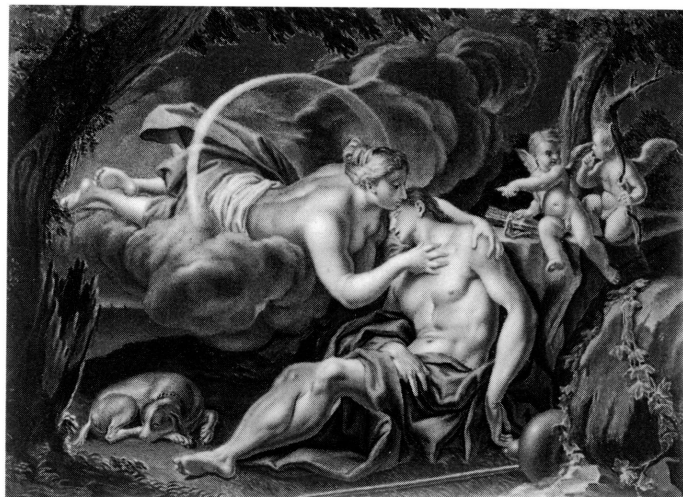
1. Jean-Etienne Liotard, Séléné et Endymion , miniature sur émail.