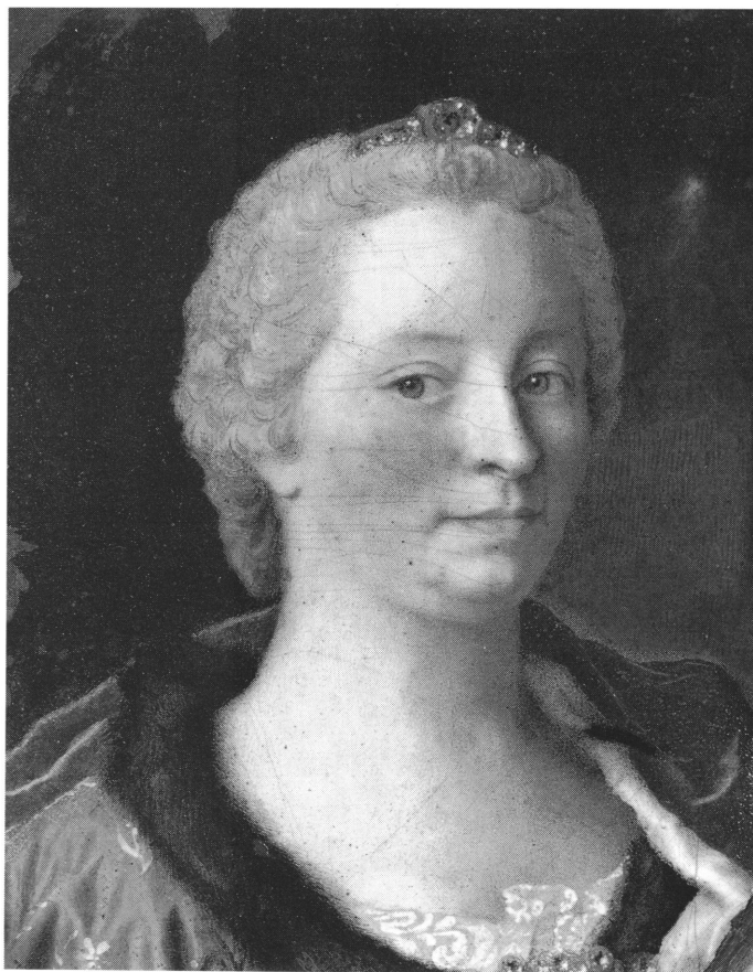
10. Jean-Etienne Liotard, Portrait de l'impératrice Marie-Thérèse , miniature sur émail.