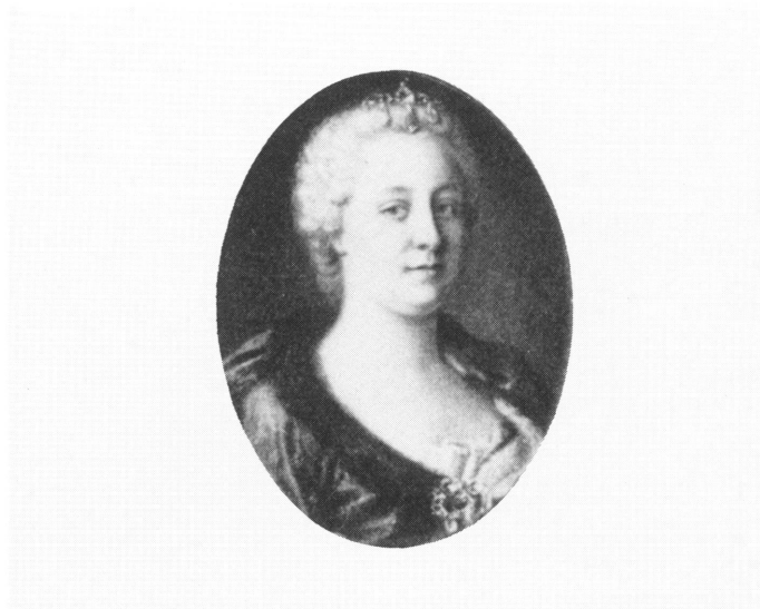
9. Jean-Etienne Liotard, Portrait de l'impératrice Marie-Thérèse , miniature à la gouache.