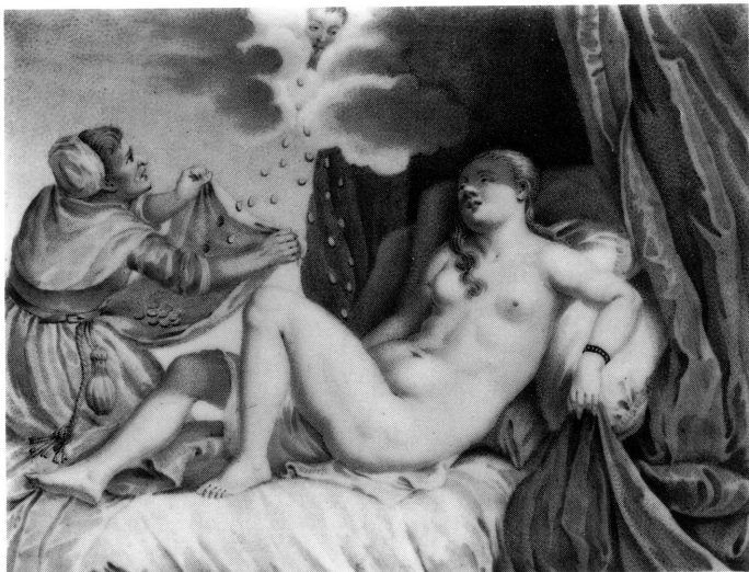
2. Jean-Etienne Liotard, Danaë , émail genevois.