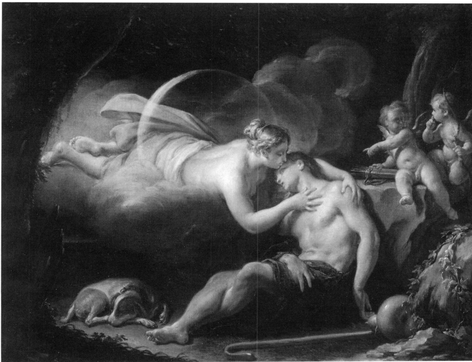
7. Francesco Trevisani, Séléné et Endymion , huile, version modifiée par l'artiste.