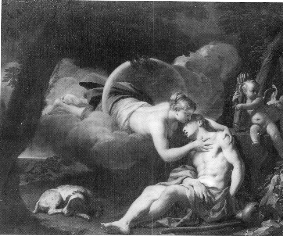
6. Francesco Trevisani Séléné et Endymion , huile, version originale.