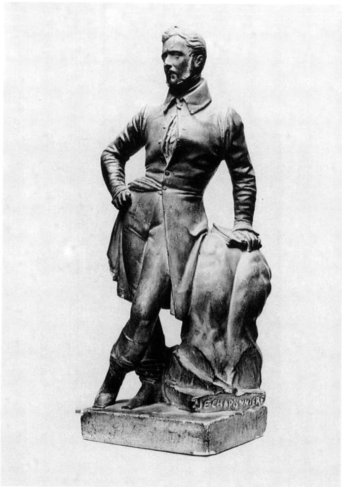
2. John-Etienne Chaponnière, Portrait de James Pradier , plâtre, 42 cm, signé: J.E. CHAPONNIÈRE, 1832. Genève, Musée d'art et d'histoire, inv. 1905-9.

une médaille de deuxième classe 13 . Mais en dépit des promesses de Monsieur de Forbin, directeur des musées nationaux, à la fermeture du Salon aucune commande ne lui parvient 14 . Toutefois au mois de septembre de la même année, c'est à lui que s'adresse le Ministère du Commerce et des Travaux publics pour l'exécution d'un buste en marbre du duc de Nemours 15 .