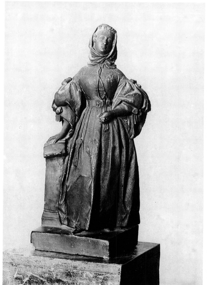
3. John-Etienne Chaponnière, Portrait de Juliette Drouet , plâtre, 42 cm, signé J.E. CHAPONNIÈRE, 1832, photographie d'après un original perdu. Genève, Musée d'art et d'histoire.