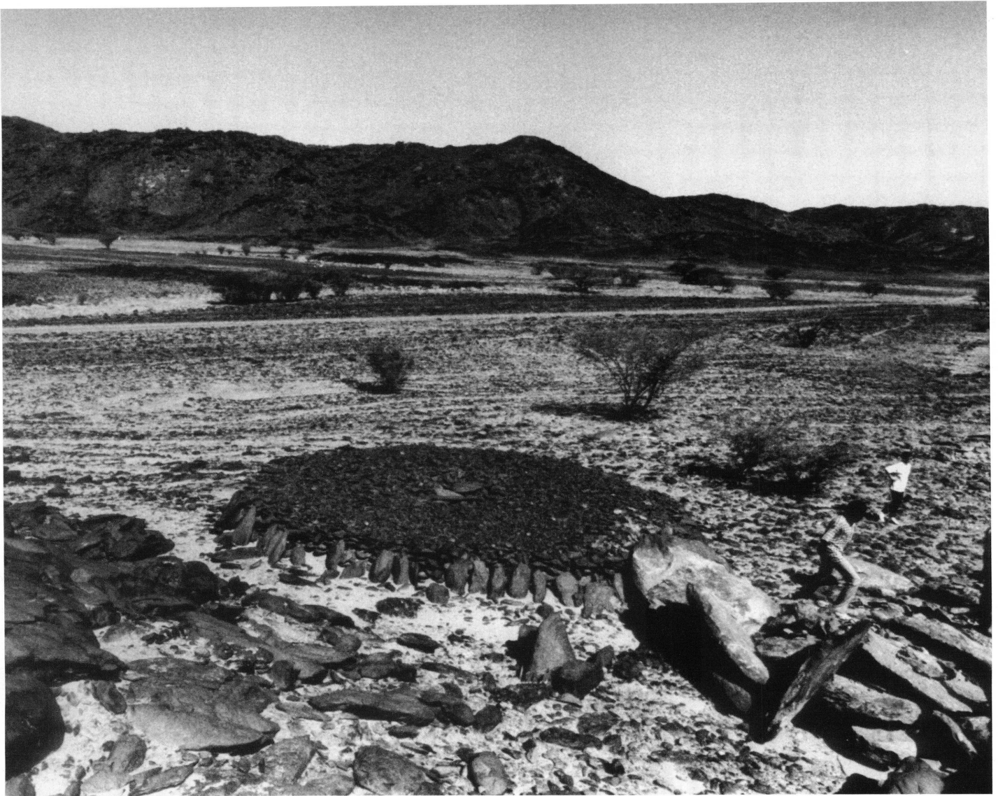
4. Une tombe monumentale près des mines d'Ariab.

des montagnes de la mer Rouge. La mine d'or est située à Hassai, soit à environ 600 km au nord-est de Khartoum, dans un territoire très accidenté où de larges ouadis ont néanmoins favorisé le pastoralisme dès l'antiquité. Aujourd'hui encore, une population nomade ou partiellement sédentarisée est installée dans les plaines où de rares arbres témoignent encore de la proximité des nappes phréatiques. De nombreux puits marquent les points de rassemblement des hommes et du petit bétail.