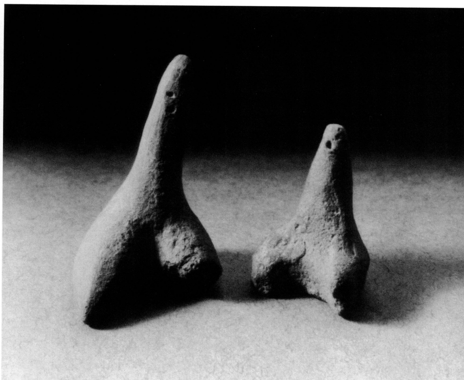
5. Figurines en terre.

Ces structures se trouvent sur des terrasses proches du niveau des ouadis, sur les replats dans la pente des djebels et même assez souvent sur la hauteur. Dans ce dernier cas, leurs silhouettes se détachent sur l'horizon et se voient de très loin. Généralement groupées (3 à 12), elles peuvent aussi être isolées.