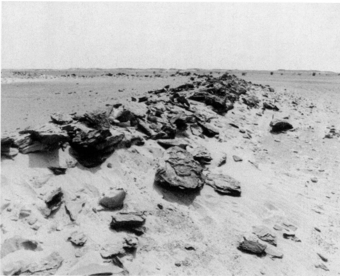
2. L'enceinte.