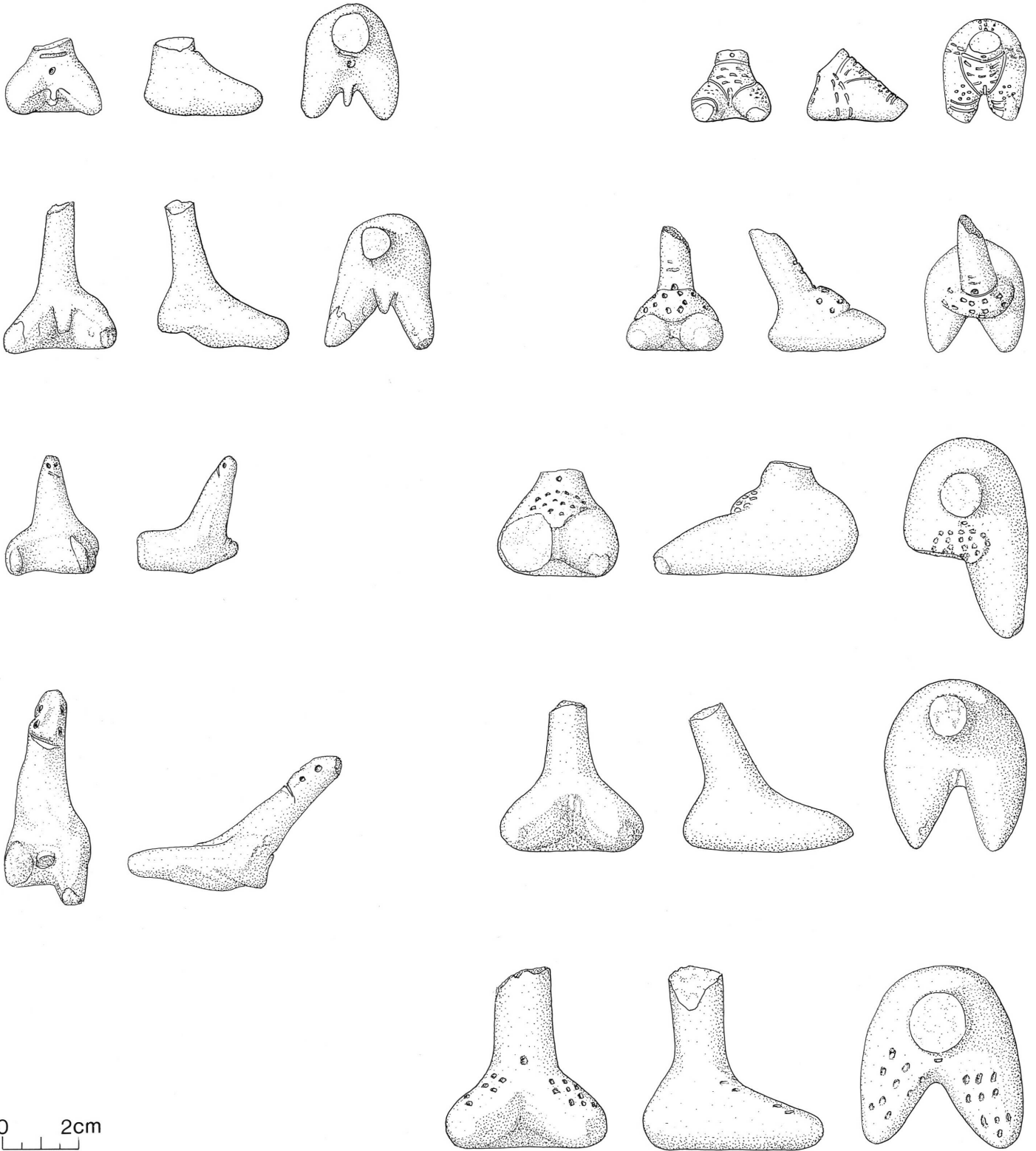
7. Figurines anthropomorphes (dessin M. Ferrière).