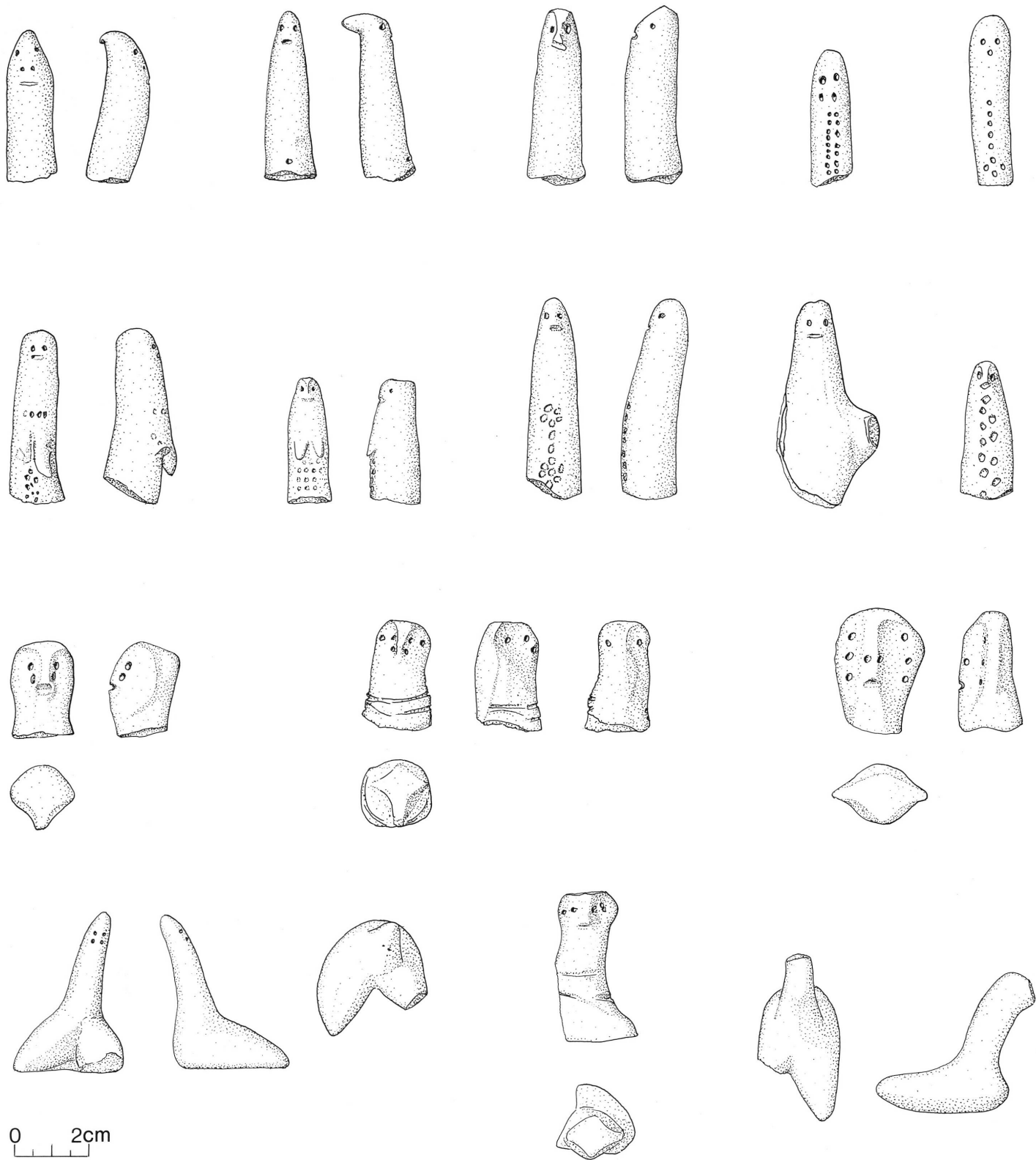
6. Figurines anthropomorphes (dessin M. Ferrière).