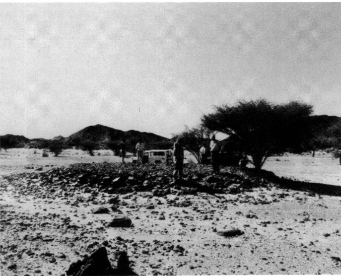
3. Observations près de la mine d'Ariab.