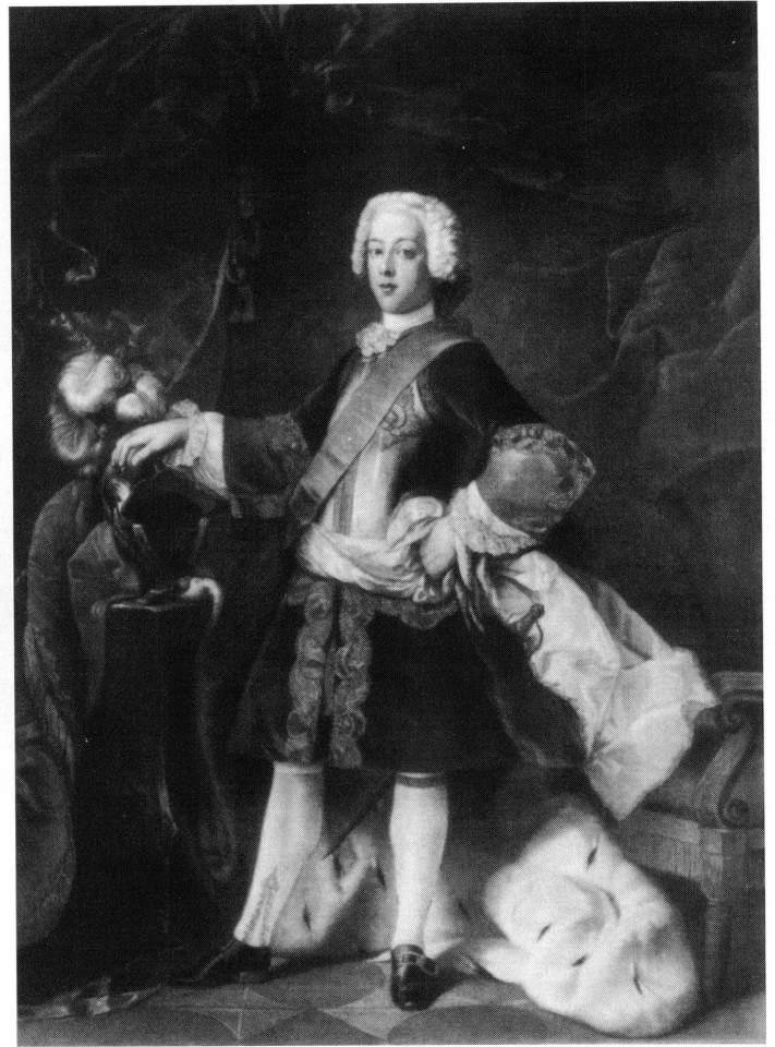
5. Louis-Gabriel Blanchet, Charles-Edward Stuart . Huile sur toile. Collection privée.

alors qu'il avait douze ans, il séjourna à Rome avec son frère et son père, James-Francis-Edward Stuart, dit le Prétendant, et avec sa mère, Maria Clementina Sobieski. Dans le même temps, Liotard se trouvait, lui aussi, à Rome et allait s'embarquer au printemps de l'année 1738, depuis Naples, pour son voyage à Constantinople 5 .