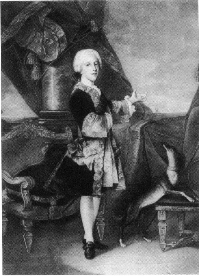
4. Louis-Gabriel Blanchet, Henri-Benedict-Marie-Clement Stuart . Huile sur toile. Collection privée.