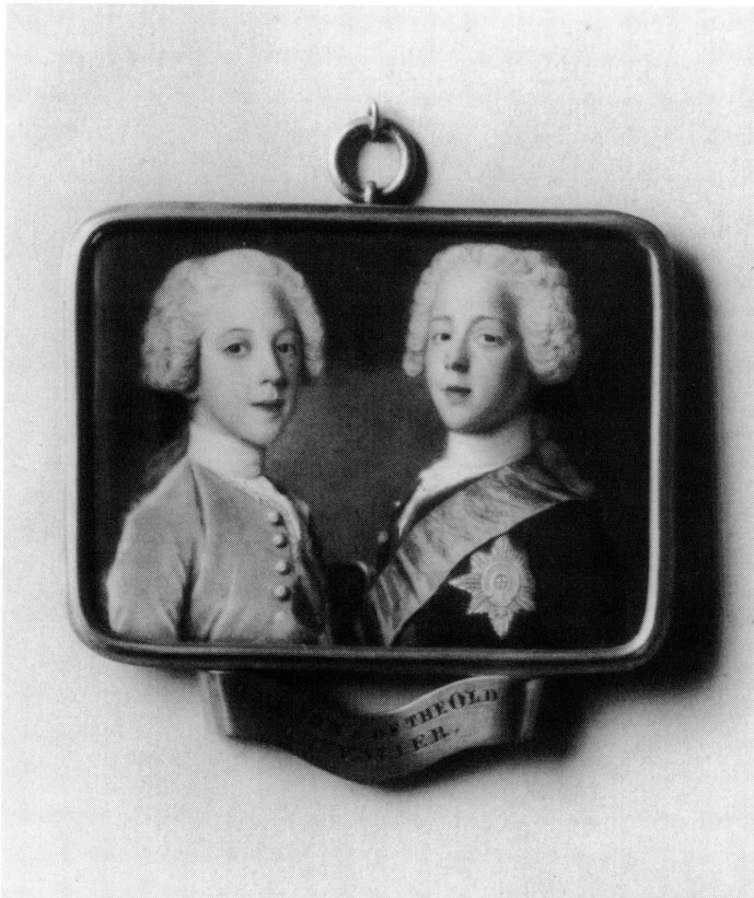
6. Henri-Benedict-Marie-Clement Stuart et Charles Edward Stuart. Miniature sur émail. Collection du Duc de Baccluch.

de Blanchet dans la manière dont il a capté la psychologie des visages.