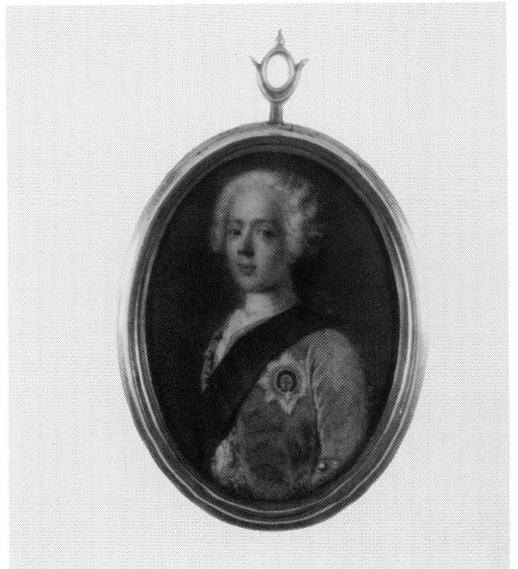
7 a, b, c, d. James-Francis-Edward Stuart, «The Old Pretender», son épouse Maria Clementina Sobieski ainsi que leurs deux fils Henri-Benedict-Marie-Clement et Charles-Edward Stuart. Quatre miniatures à la gouache. Collection privée.