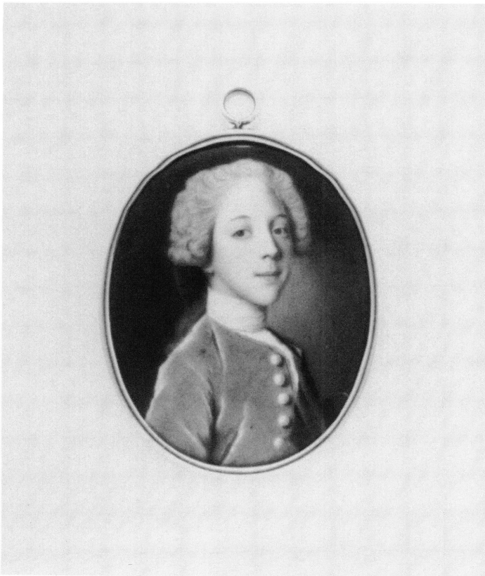
2. Jean-Etienne Liotard «par lui-même» . Miniature sur émail. Genève, Musée de l'horlogerie et de l'émaillerie.