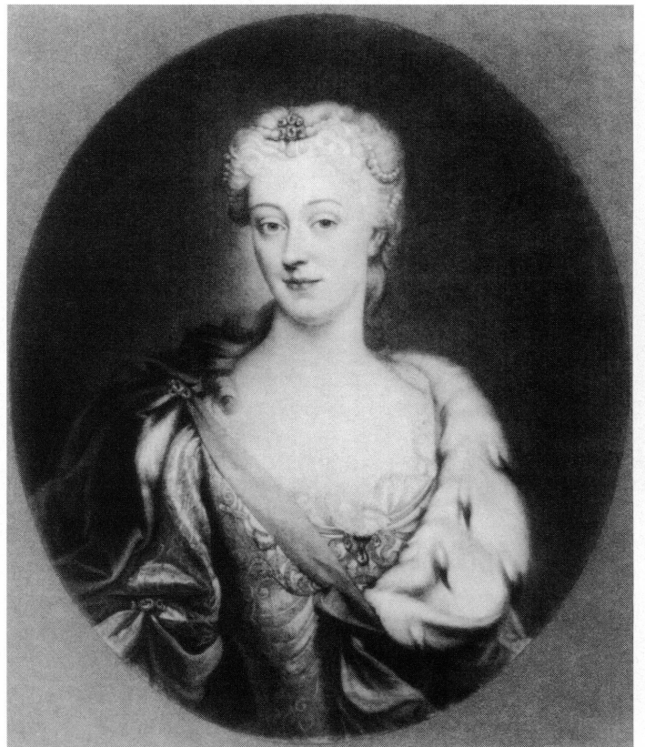
8. Nicolas de Largillière, Portrait en buste de Maria Clementina Sobieski . Huile sur toile. Collection privée.

Par contre, la miniature en émail présentée ci-dessus, l' autoportrait de l'artiste, laisse deviner la somme d'expériences que Liotard a pu acquérir en Orient. Plus tard, ses gravures 11 vont aussi, à leur tour témoigner de la réception de ses expériences nouvelles. De même, cet apport apparaît dans la miniature sur émail de son autoportrait en habit turc , qui fait l'objet des observations qui suivent.