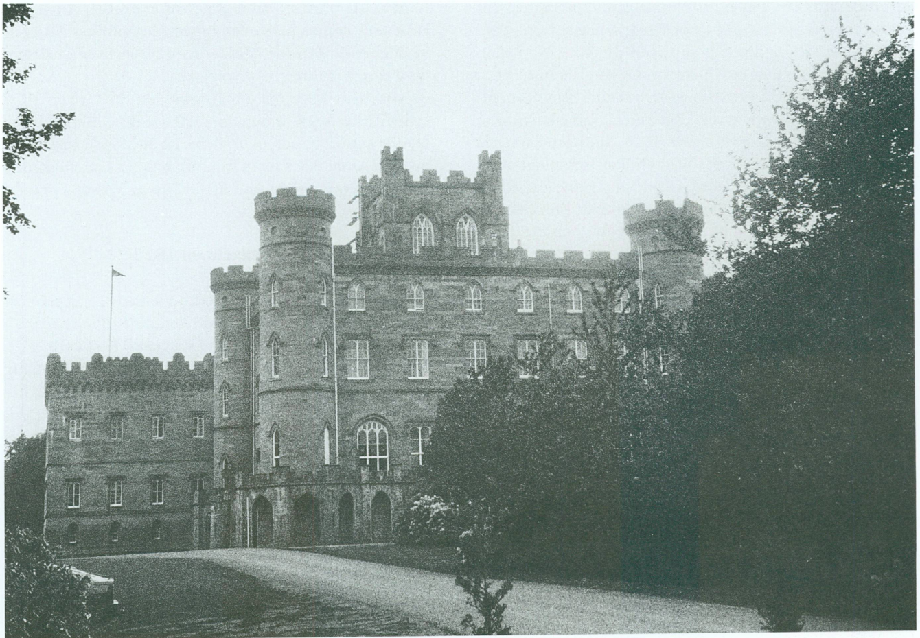
3. Vue de Taymouth Castle, Kenmore, Perthshire.

«... tu n'as pas d'idée comme ma santé s'est fortifiée; pense que malgré toutes les contrariétés et l'enuey que j'ai éprouvé; je n'ai pas eu un moment de malaise cependant j'ai travaillé plus qu'en aucun temps de ma jeunesse, je dois je crois les bonnes fonctions de mon estomac, à la tempérance que je me suis prescrite, car malgré toutes les Venaisons les foisans et les Perdrix, ainsi que tous les poissons d'eau douce et de mer, je vis comme chez moi,