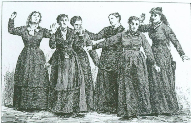
7. «Catalepsie provoquée par un bruit intense et inattendu», publié par P. Régnaud dans Les Maladies épidémiques de l'esprit en 1887

l'imprécation gestuelle des patientes mais aussi par le récit dramatique de chacune d'entre elles, ainsi que le relate Charcot à propos de leurs hallucinations et autres attitudes passionnelles: «le malade entre lui-même en scène et par la mimique expressive et animée à laquelle il se livre, les phrases entrecoupées qui lui échappent, il est facile de suivre toutes les péripéties du drame auquel il croit assister: [...] guerres, incendies, révolutions» 10 .