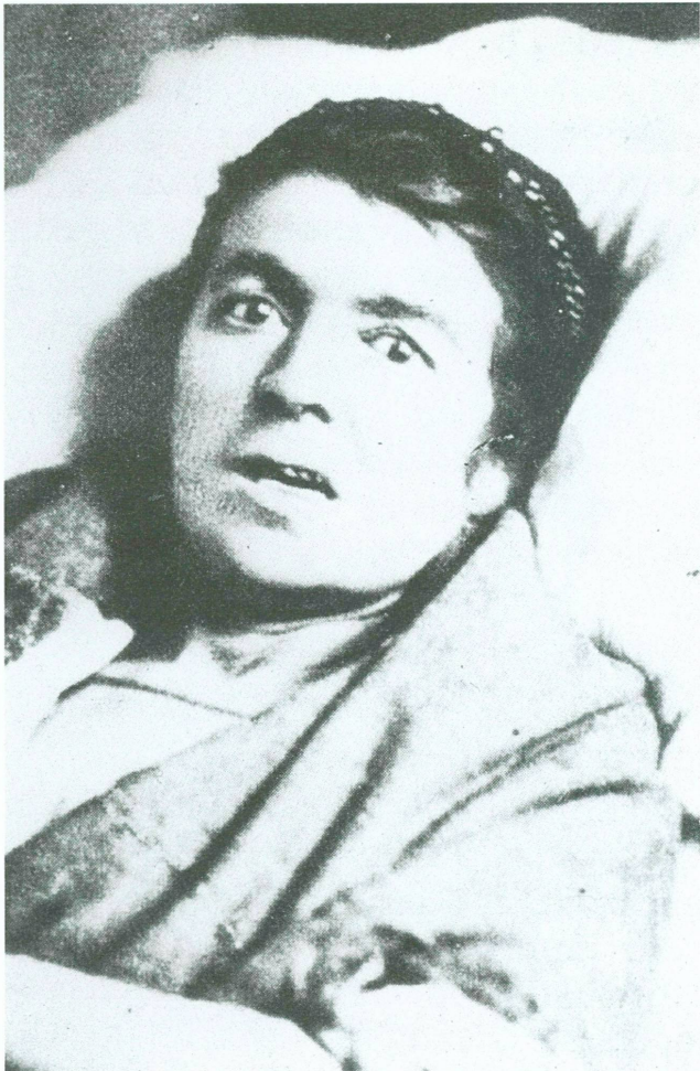
6. «Contracture de la face», dans Bourneville et Régnaud, Iconographie photographique de la Salpêtrière , tome I