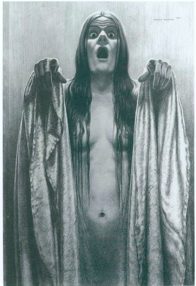
2. Carlos Schwabe, Etude pour La Vague (n° 4), 1907, fusain, crayon gras, sanguine, rehauts de pastel, 100 x 67,5 cm. Genève, Cabinet des dessins du Musée d'art et d'histoire, Inv. 1985-8

C'est pour illustrer le chapitre XXIV des Paroles d'un croyant que Schwabe imagina de figurer une vague déferlante par le surgissement de sept femmes hurlantes et paroxystiques. «Tout ce qui arrive dans le monde a son signe qui le précède, écrit en effet Lamennais, lorsque la tempête vient, on entend sur le rivage un sourd bruissement, et les flots s'agitent comme d'eux-mêmes.» L'utilisation de la mer déchaînée est en effet ici une métaphore de la révolte, du «mouvement intérieur des peuples en émoi», «signe précurseur de la tempête qui passera bientôt sur les nations tremblantes», tandis que s'annonce le «lever du soleil des intelligences».