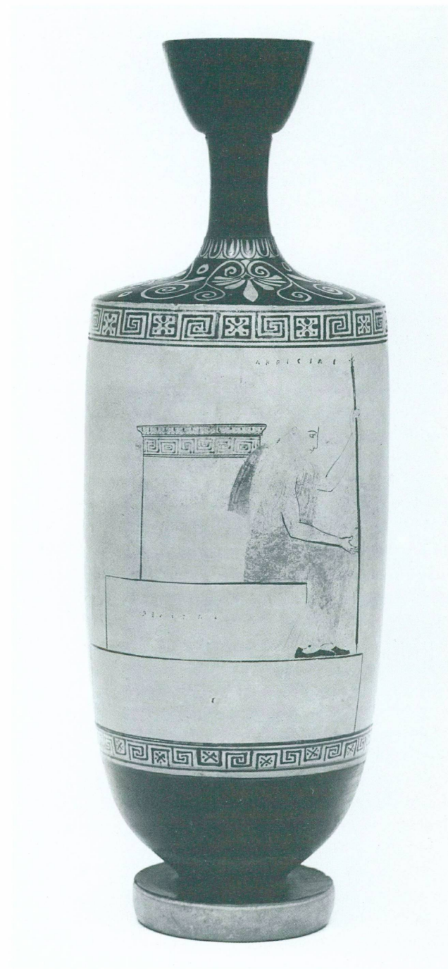
Le vieux roi Akrisios, assis sur un monument funéraire. Lécythe à fond blanc, attique, attribué à un grand maître, le peintre d'Achille. Vers 450 avant J.-C. Don de M me Inès Jucker, déposé par l'Association Hellas et Roma au Musée d'art et d'histoire de Genève

L'objet en question est un lécythe, vase à parfum destiné aux rites funéraires. D'une taille inhabituelle (42,5 cm), il est décoré selon la technique dite à fond blanc. Quant à la scène représentée, elle n'appartient pas à la vie quotidienne, comme d'ordinaire, mais à la mythologie. Le vieillard qu'on voit assis sur les marches d'un tombeau est Akrisios (identifié par une inscription), roi d'Argos et père de Danaé. Selon la légende, celle-ci a enfanté de Zeus, à l'insu de son père, un fils nommé Persée. La tombe sur laquelle repose Akrisios serait, si l'on en croit la deuxième inscription figurant sur le vase, la chambre souterraine dans laquelle le roi a enfermé sa fille pour empêcher la réalisation de l'oracle selon lequel le roi serait tué par son fils à naître.