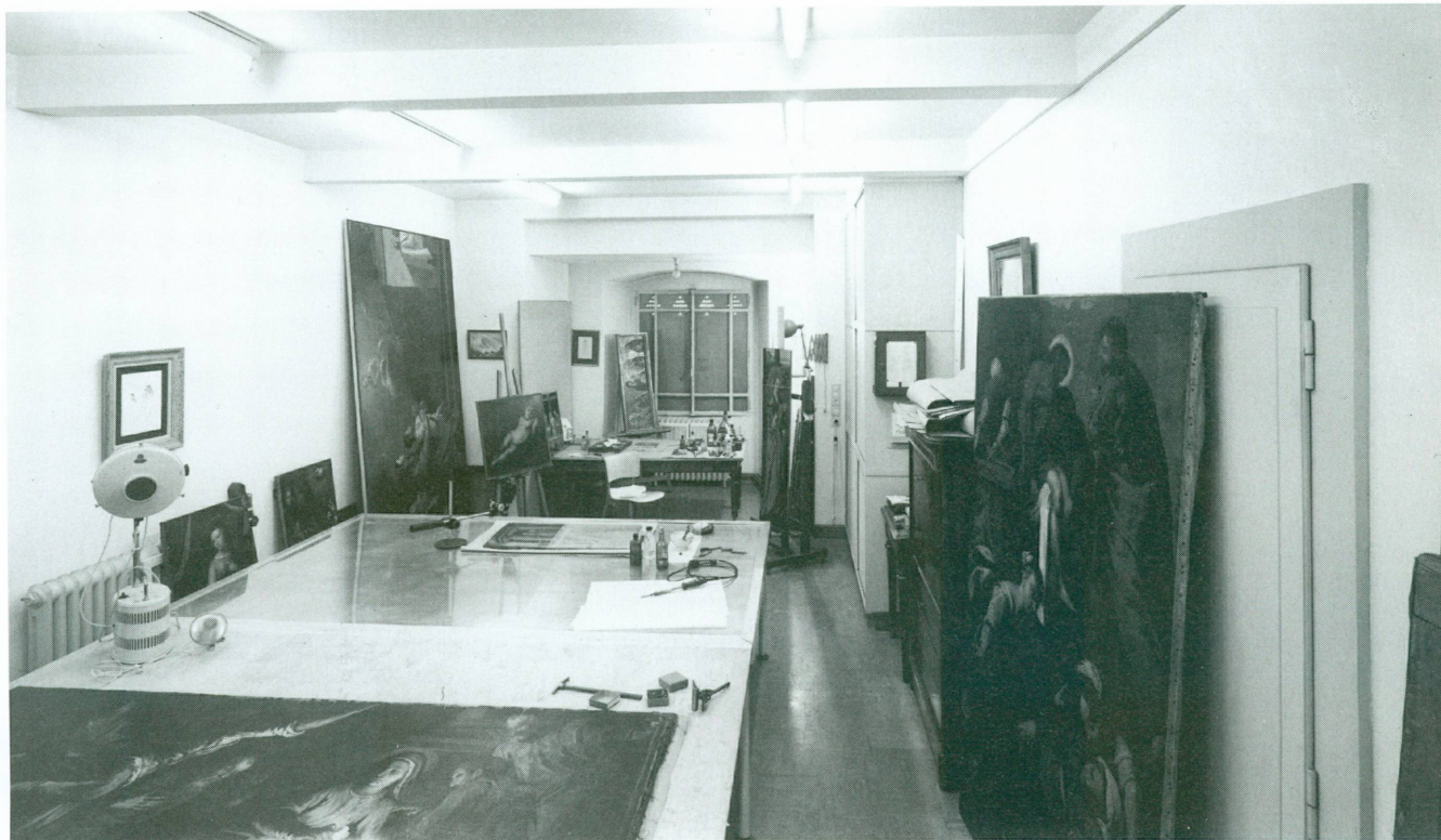
1. Vue de l'atelier de restauration de peinture en 1964. Au premier plan, la table chauffante, appareil très en vogue à cette époque pour le rentoilage des peintures

«... la raison principale justifiant les sacrifices financiers et l'effort que nécessitent la création d'ateliers de restauration, le recrutement et la formation du personnel spécialisé, c'est le changement fondamental qui s'opère dans un musée lorsqu'il dispose de ses propres ateliers. [...] En associant le conservateur au restaurateur et en mettant à leur disposition un laboratoire de recherche, on donne naissance à une nouvelle approche, interdisciplinaire, de l'œuvre d'art: le musée devient centre de recherche, préoccupé non seulement de la simple conservation de l'œuvre d'art, mais aussi de sa technologie, c'est-à-dire de l'étude des matières qui la constituent et de l'étude des techniques employées lors de sa fabrication. L'archéologue et l'historien de l'art s'enrichissent d'un nouveau savoir qui leur permet de progresser dans leurs travaux.»