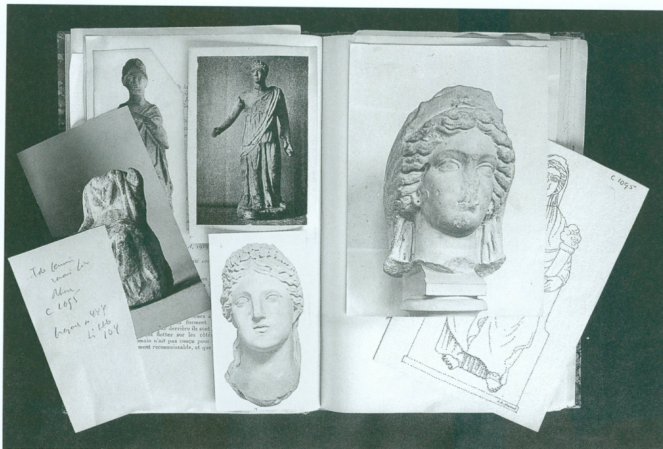
2. En 1924, Waldemar Deonna publiait le Catalogue des sculptures antiques du Musée d'art et d'histoire. Son exemplaire personnel, ici ouvert aux pages 70-71, a été conservé. Les photos et les fiches griffonnées, collées ou simplement glissées à l'intérieur, montrent que le savant ne cessait jamais de revenir sur un sujet, en vue d'autres publications.

par une curieuse ironie du sort, ce qui est le plus contesté dans son œuvre est ce à quoi il tenait le plus, c'est-à-dire ses théories esthétiques, comme celle de l'alternance du classicisme et du primitivisme 6 . Mais on admire encore comment, dans le « Mobilier délien » 7 , il a su traiter avec une méticulosité rigoureuse un sujet délaissé (les terres cuites) et procéder à des classements judicieux. Son livre le plus célèbre auprès des archéologues, Les Apollons archaïques 8 , où il est question des origines de la statuaire grecque, est aujourd'hui remplacé, mais le travail que l'auteur a accompli pour rassembler les œuvres éparses demeure exemplaire. Gisela Richter 9 , qui a repris ce thème après Waldemar Deonna, a reconnu sa dette envers lui 10 . D'une manière générale, force est de reconnaître que les écrits de Waldemar Deonna fourmillent d'idées fulgurantes, de rapprochements inattendus, de références introuvables ailleurs.