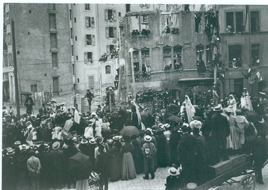
112. Photographe inconnu | Cortège historique du 1 er juin 1903 | Épreuve à l'albumine montée sur carton, 11,9 × 16,6 cm (CIG, coll. icon. BPU, Album Troisième centenaire de l'Escalade - Cortège 1903 , inv. Rec Est 182/8.1)