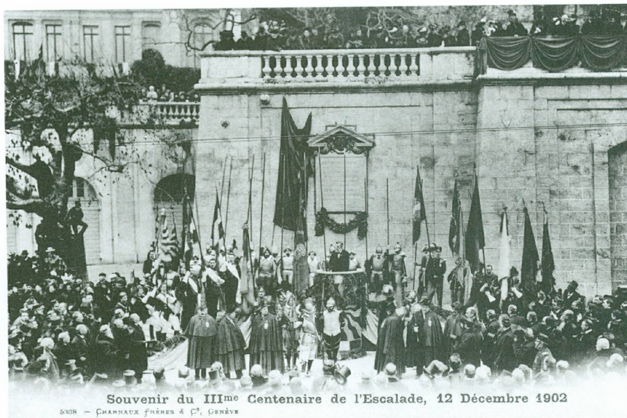
Souvenir du III me Centenaire de l'Escalade, 12 Décembre 1902