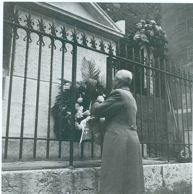
126-129. Lecture de la Proclamation au Bourg-de-Four et cérémonie officielle au Monument aux morts de Saint-Gervais, 14 décembre 1952 | Négatifs au gélatino-bromure sur acétate, 6 × 6 cm

1952, dimanche 14 décembre, en début d'après-midi, ciel couvert. Le héraut donne lecture de la Proclamation en ville, aux endroits habituels. À Saint-Gervais, la traditionnelle cérémonie devant le monument aux victimes de l'Escalade prend une dimension particulièrement solennelle, due à la présence des représentants des autorités cantonales et municipales et du général Henri Guisan, qui dépose une gerbe rouge et blanche au pied de la stèle commémorative.