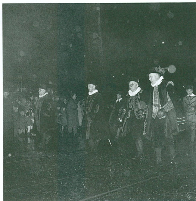
130-133. | Cortège du 350 e anniversaire de l'Escalade, 14 décembre 1952 | Négatifs au gélatino-bromure sur acétate, 6 × 6 cm

1952, dimanche 14 décembre, à 17 heures, au début sous la pluie, sous la neige après 18 heures. Cortège historique augmenté de nombreux groupes officiels, militaires et civils. La longue colonne qu'il forme met plus d'une heure à défiler. Son itinéraire: place Neuve, Corratierie, Rues-Basses, place Longemalle, rue du Rhône, place Bel-Air, ponts de l'Île, rue de Coutance, rue des Corps-Saints, rue du Temple, rue des Terreaux-du-Temple, pont de la Coulouvrenière, boulevard Georges-Favon, place du Cirque, rue Alexandre-Calame et retour à la place Neuve, avec cérémonie solennelle de clôture.