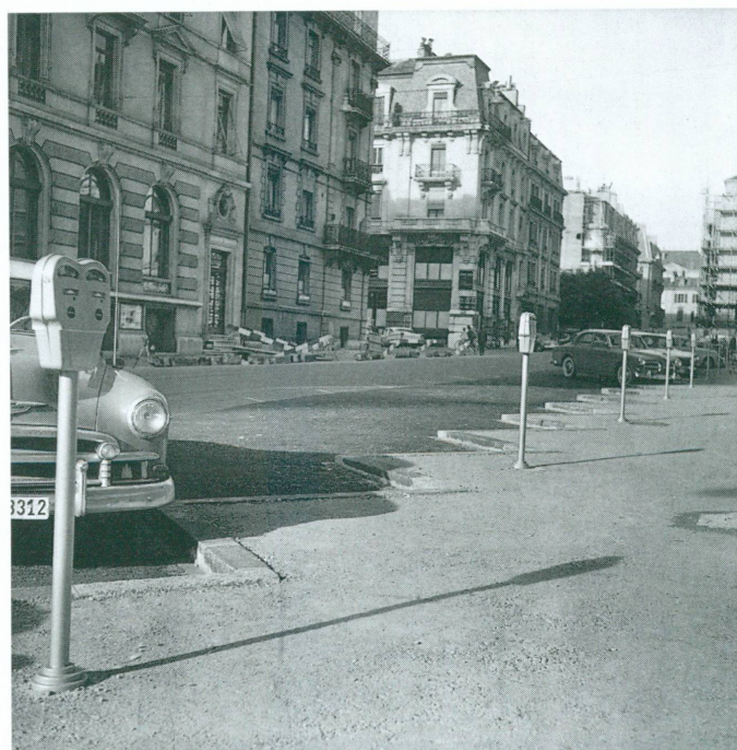
3-6. Photographes anonymes | Négatifs au gélatino-bromure sur acétate, 6 × 6 cm | Achat (CIG, fonds Interpresse, s.n.)

3. La patinoire des Vernets, le soir de son inauguration, 28 novembre 1958 | 4. Lors de la conférence du Laos, Andreï Gromyko, ministre soviétique, s'adresse « l'air navré » aux journalistes, à l'entrée de l'ambassade de la rue de la Paix, 4 mai 1961 | 5. Sur les marches de la Mairie des Eaux-Vives, les nouveaux mariés Viviane Lecerf et l'acteur Stewart Granger, accompagnés de Jamie Granger, fils de ce dernier, et de David Niven, témoin de mariage, 8 juin 1964 | 6. Les premiers parcomètres installés rue Général-Dufour, 6 juin 1961 | Le commentaire d'époque précise : « Dès leur apparition ceux-ci n'obtinrent aucun succès et les automobilistes qui avaient l'habitude de parquer là, gratuitement, leur voiture, ont déserté le quartier et vont parquer dans les alentours, ce qui dans certains endroits crée de beaux embouteillages. [...] La photo a été prise à 11 h. du matin, soit dans ce quartier à l'une des heures de pointe pour le parage. »