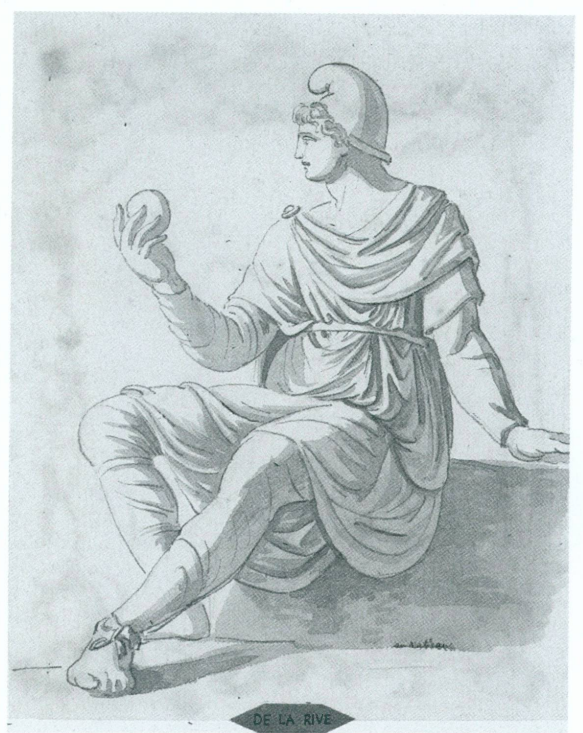
3-6. Pierre-Louis De la Rive (1753-1817) | Voie antique dans la campagne romaine (étude) , 1785 | Crayon de graphite et lavis d'encre de Chine, 215 × 430 mm (Genève, Mirabaud & Cie, banquiers privés, inv. GE-D-44) | Étude d'après le « Faune capitolin » , copie d'après Praxitèle, 1785 | Plume et pinceau, lavis de bistre, encre noire, 310 × 140 mm (Genève, Mirabaud & Cie, banquiers privés, inv. GE-D-46) | Étude d'après Polidoro da Caravaggio, dans la Chambre de Constantin au Vatican , 1785 | Plume et pinceau, lavis d'encre de Chine, rehauts à la plume et bistre, 210 × 100 mm (Genève, Mirabaud & Cie, banquiers privés, inv. GE-D-51) | Étude du « Pâris assis », dit le « Pâris Altemps », au Vatican , 1785 | Plume et pinceau, lavis d'encre de Chine, 183 × 147 mm (Genève, Mirabaud & Cie, banquiers privés, inv. GE-D-50)