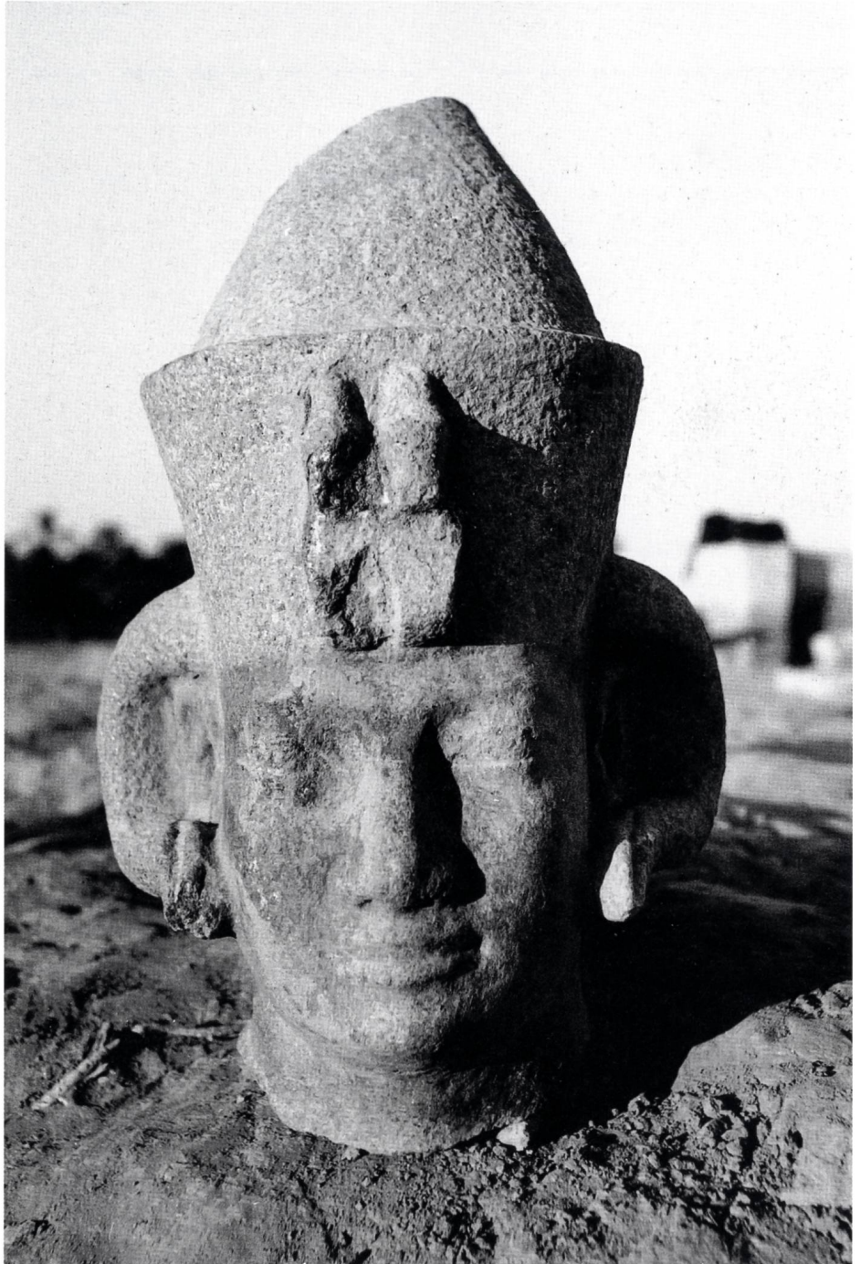
8. Tête en granit noir de la statue d'Anlamani pourvue des cornes d'Amon

L'ensemble de ces attestations vient confirmer, s'il en était encore besoin, l'équation Kerma égale Pnoubis sous la XXV e dynastie et pendant la période napatéenne 10 . En outre, toutes ces inscriptions, précisément datées, fournissent des indices paléographiques précieux pour situer chronologiquement certaines des mentions isolées du toponyme que l'on peut lire sur divers fragments de blocs isolés, recueillis sur le site de Doukki Gel.