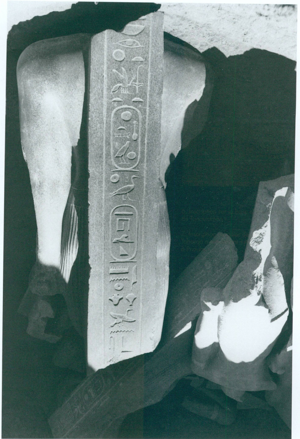
7. Inscription du pilier dorsal de la statue de Taharqa mentionnant « Amon-Rê qui réside à Pnoubis ».

Napata sont définitivement évincés d'Égypte par Psammétique I er . Pourtant, les insignes du pouvoir royal égyptien restent en usage, comme le pschent figurant sur l'une des statues de Senkamaniskén et sur celle d'Anlamani. Cette dernière comporte en outre un attribut que l'on peut contempler pour la première fois en ronde-bosse : les cornes d'Amon (fig. 8) évoquant le caractère divin du souverain 9 . Là encore, l'épithète des souverains que l'on peut lire sur les piliers dorsaux des statues ainsi que sur les bases d'une statue de Senkamaniskén et de celle d'Aspelta est « aimé d'Amon de Pnoubis ».