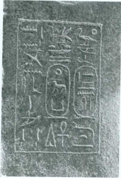
6. Inscription sur la base d'une des statues de Tanoutamon