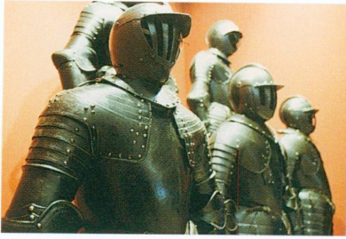
1. Exposition C'était en 1602 : Genève et l'Escalade : vue partielle du trophée des armures noires, dites « de l'Escalade »