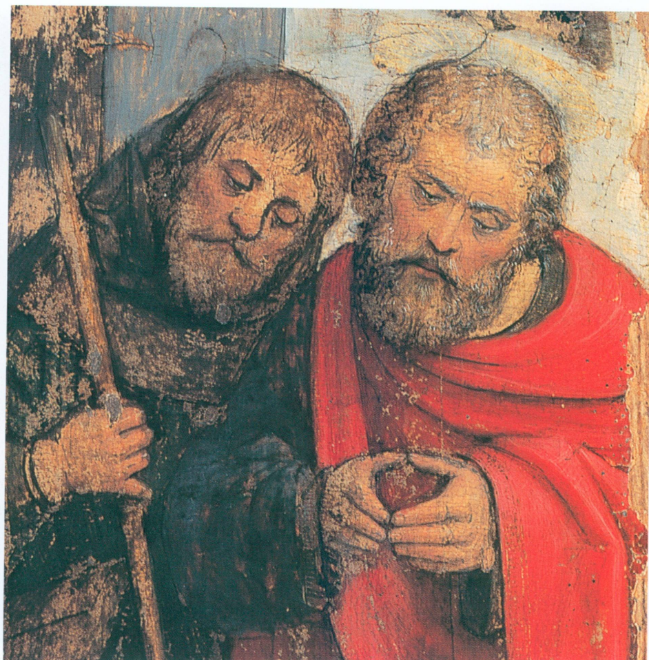
5. Collaborateur de Defendente Ferrari | Adoration des bergers , vers 1515-1518 | Tempera grasse sur bois de conifère, 116 × 64,5 cm (Genève, MAH, inv. 1980-208) | Détail

œuvre essentielle au corpus de l'exposition, propriété de la cathédrale de Biella, nous a permis d'en obtenir le prêt exceptionnel auprès des autorités italiennes.