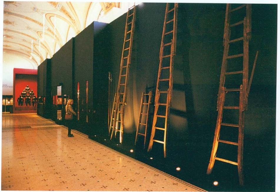
2. Exposition C'était en 1602 : Genève et l'Escalade : les souvenirs de l'Escalade