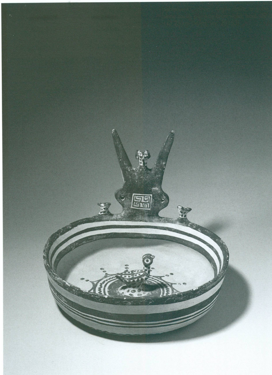
6. Kyathos cornu à l'oiseau , Daunien II, probablement Ortona | Argile claire, engobe blanc cassé, peinture brun-violet, haut. 20 cm × Ø 25 cm (MAH, inv. 20153)

céramique produite dans la région adriatique par les peuples indigènes qui, du VII e au III e siècle av. J.-C. (fig. 6), vivaient en marge des colonies grecques, a permis de réunir des pièces rares provenant toutes de collections genevoises, hormis deux d'entre elles, prêtées à titre exceptionnel par le Paul J. Getty Museum de Malibu. Le catalogue de l'exposition, dans lequel chacun de ces objets est reproduit en couleurs, fera date puisqu'il s'agit du premier livre d'art jamais consacré aux Iapyges. Cette exposition permet également au Musée, après L'Art des peuples italiques en 1994, de renouer avec la Mona Bismarck Foundation de Paris, où elle a été présentée en février 2003.