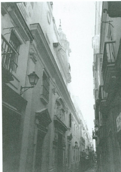
15. Calle San Agustin, boutique Malibran Frères