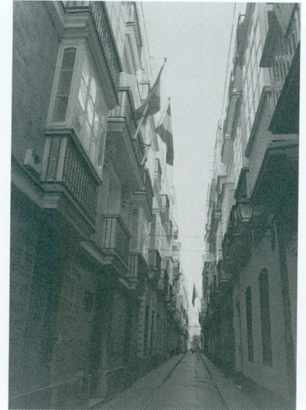
18. Calle Ahumada, domicile de Patricio Noble