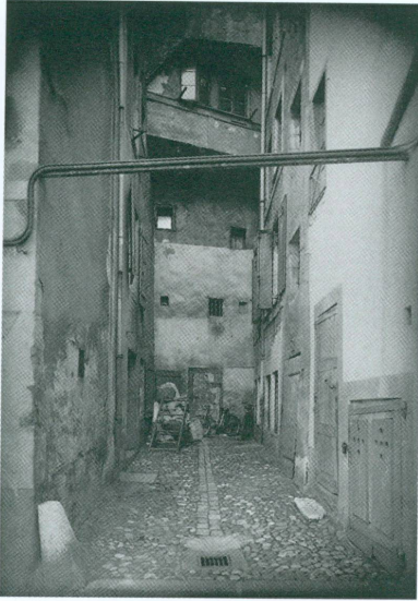
4. Vue de l'impasse prise du chevet de la Madeleine. Les immeubles de gauche ont disparu, le fond de l'impasse est actuellement occupé par la terrasse Agrippa-d'Aubigné ; à droite, le mur subsiste, c'est le pignon oriental de l'îlot (CIG, inv. VG N 13 × 18 875).