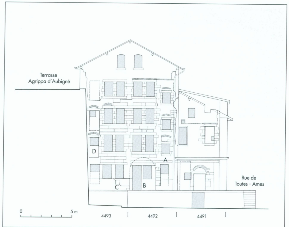
5. Îlot de la Taverne · Élévation est

est le seul vestige subsistant de la façade médiévale (fig. 5, lettre C). Contre le mur de la terrasse Agrippa-d'Aubigné, la façade à son extrémité gauche et sur toute sa hauteur présente, comme celle du sud, une superposition de portes aujourd'hui en partie murées qui, sur trois ou quatre niveaux, ouvraient sur des couloirs permettant par-dessus l'impasse de joindre par des galeries l'immeuble vis-à-vis (fig. 5, lettre D). À partir des linteaux des fenêtres du troisième étage, le triangle du pignon est entièrement en plots de ciment, une construction des années 1920-1930. Auparavant, les deux bâtiments étaient plus nettement différenciés dans leurs superstructures. À droite, le mur était gouttereau et supportait une toiture à pan unique qui recouvrait toute la parcelle 4492. À gauche (parcelle 4493), c'est la rue des Barrières sur laquelle le toit présentait une pente unique qui recevait les eaux de pluie (fig. 6).