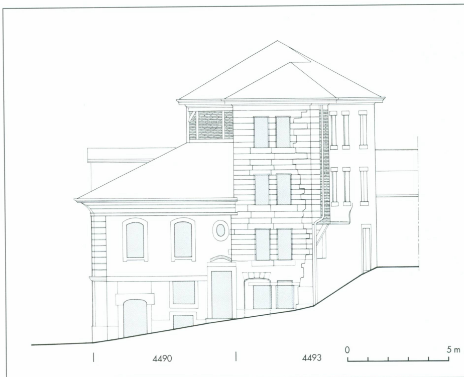
Vers le passage de Monnetier et le Perron · Façade ouest (parcelle 4493)

La façade qui regarde l'ancienne école, plus tard Bibliothèque de la Madeleine, a reçu, au XVII e siècle, sans doute, un traitement homogène lui aussi d'une grande austérité. Le mur d'assises régulières de longs blocs de molasse est percé de fenêtres géminées élancées, soulignées de battues recevant les volets. Cette apparente unité est cependant trahie à droite par une ligne verticale de rupture d'assises qui sépare la façade de sa chaîne d'angle, souvenir d'une façade antérieure qui s'appuyait, sans toutefois en être solidaire, sur l'appareil de briques du milieu du XV e siècle (fig. 7).