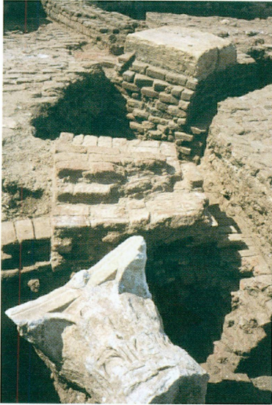
5. L'église est dévastée au VI e ou au VII e siècle. 6. Un bain du IX e siècle