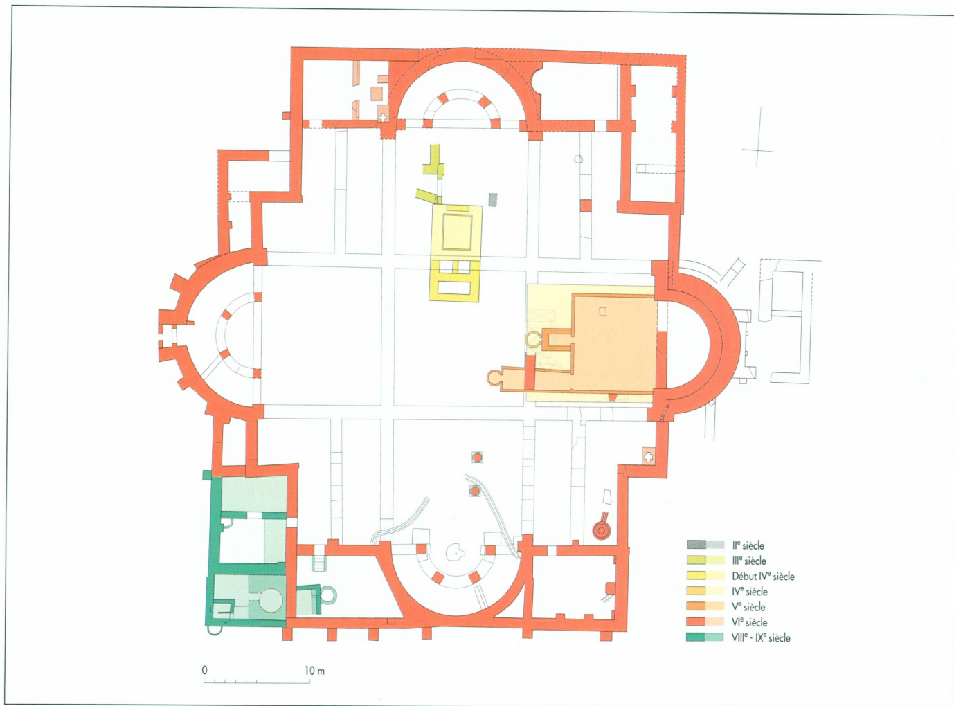
1. Plan schématique de l'église cruciforme tétraconque de Farama

que les montants d'une grande porte mesurant 1,60 mètre de largeur par plus de deux mètres de hauteur, ce qui n'a pas manqué de nous surprendre. D'autres murs associés à cette ouverture permettent d'affirmer qu'un complexe architectural dissocié des bains voisins se développait dans ce secteur. D'énormes quantités d'ossements d'animaux et des amphores en nombre, provenant de plusieurs sites du Bassin méditerranéen, laissent penser qu'il s'agit de la résidence d'un personnage disposant de certains moyens. Il est probable que cette construction, qui pourrait faire partie d'une villa suburbaine, date de la fin du III e siècle; quant à son abandon, il est fixé avec précision par plusieurs monnaies de Constantin ou de Constance II (337-361) et par le type des amphores.