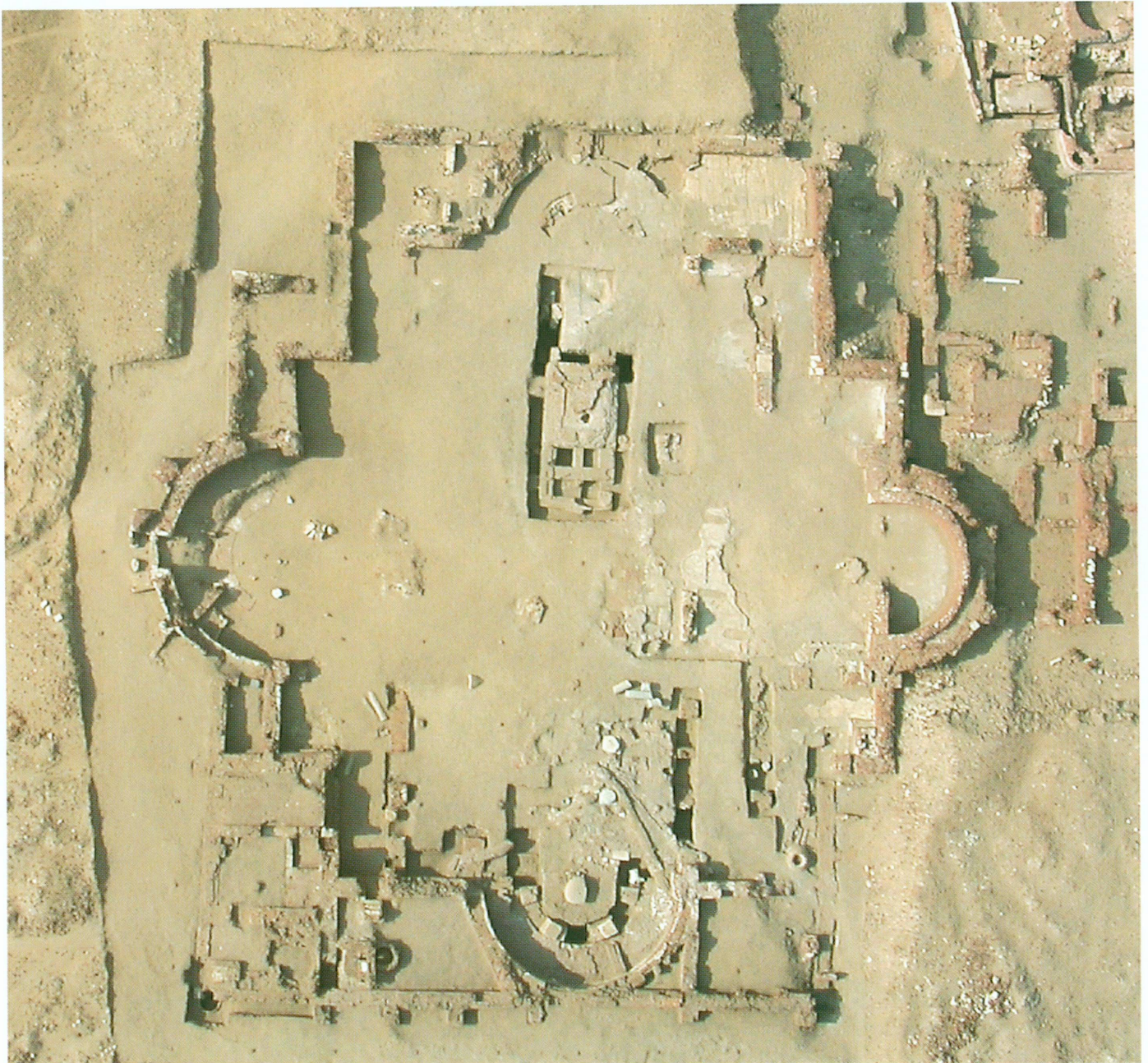
2. Vue aérienne de l'église cruciforme tétraconque de Farama

moins quatre logements destinés à des sarcophages et des tombes étaient réservés à l'intérieur (fig. 3). L'épaisseur des éléments porteurs et leur profondeur laissent supposer l'existence de voûtes au-dessus des logements. Une tombe en pleine terre orientée est-ouest et plusieurs tombeaux creusés autour de l'installation témoignent des fonctions funéraires de la construction, même si ces inhumations sont postérieures.