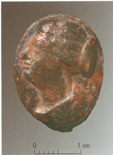
11. Farama | Fouille à l'ouest du théâtre : bague en bronze avec chaton orné d'un portrait féminin

a retrouvé quelques lambeaux du sol d'occupation de la seconde période, en particulier près du four où des briques cuites de pavement étaient associées à des amphores encore en place, dans lesquelles on mettait peut-être l'eau destinée au pétrissage et au réglage de l'hygrométrie du four pour la cuisson du pain. Qu'il s'agisse, comme pour les quatre autres fours, d'un équipement de boulangerie est en effet suggéré par les fragments de plats de cuisson circulaires retrouvés dans les fours, au-dessus d'une couche cendreuse pouvant compter jusqu'à quinze centimètres d'épaisseur.