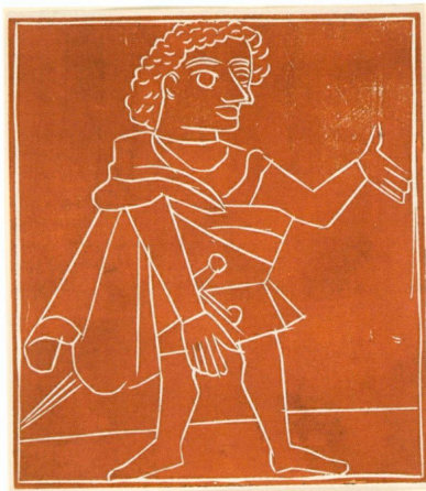
3 (à gauche). André Derain (Châtou [Yvelines], 1880 – Garches [Seine-et-Oise], 1954) | Panurge , 1943 | Xylographie (en un passage) sur chine, 227 × 201 mm (CdE, inv. 2006-249 [don Olivier Weber-Caflich]) | Tirage d'essai pour l'illustration de la page 52 du chapitre IX du Gargantua de Rabelais, Paris, chez Albert Skira, 1943