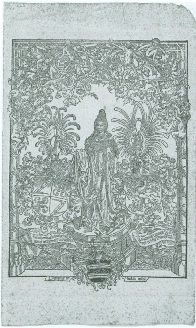
6. Erhard Reuwich (Utrecht, 1455 – Mayence, 1490), Bernard von Breydenbach (Mayence, vers 1440 – vers 1497), auteur du texte | Frontispice pour Santa Peregrinationes , [Mayence] 1486 | Xylographie sur vergé, 271 × 197 mm [CdE, inv. E 2006-12 [don du Cercle des Estampes]]

de l'infatigable activité d'Albert Skira également, la collaboration qu'il entreprit dans ces mêmes années 1940 avec André Derain (1880-1954) en vue de l'illustration du Gargantua de Rabelais (fig. 3) est désormais mieux représentée dans notre ville grâce à l'épreuve qu'Olivier Weber-Caflisch a offerte au Cabinet des estampes. Il s'agit d'une feuille de maquette portant la figure de Panurge en rouge, avant l'application des teintes supplémentaires (E 2006/249).