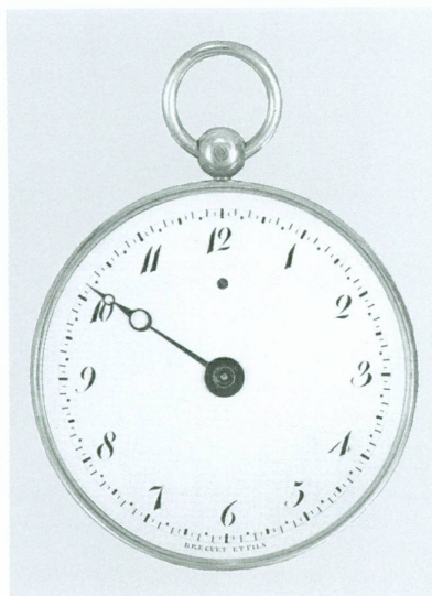
1. Abraham-Louis Breguet (Neuchâtel, 1747 – Paris, 1823) | Montre de poche, dite « souscription » , Paris, 1802 | Or, argent (inv. H 2006-101 [achat])

La campagne de reconstitution de la collection horlogère se poursuit, alimentée par des acquisitions qui sont, d'une part, des remplacements stricto sensu des objets portés manquants à l'inventaire en 2002 et, d'autre part, des appoints aux lacunes antérieures.