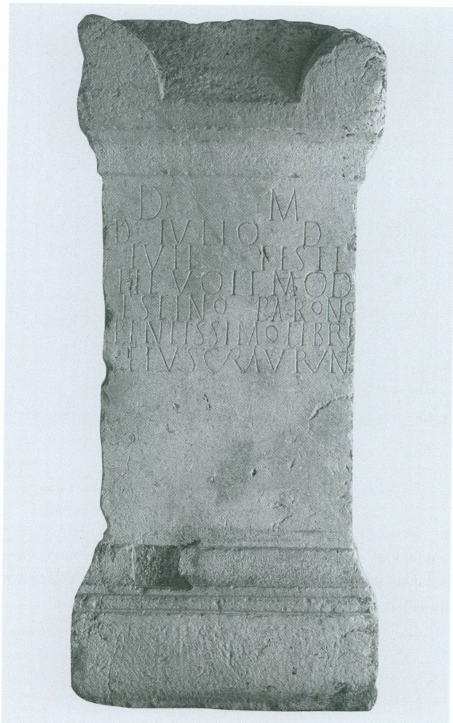
2 (en haut, à gauche). Épitaphe de D. Iulius Modestinus , Carouge, II e siècle ap. J.-C. | Moulage, 160 × 73 × 53,5 cm (MAH, inv. EPI 668 [ILN, Vienne 877 (= WIBLÉ 2005, pp. 292-294)])