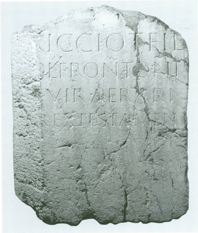
5 (à gauche). Inscription en l'honneur de T. Riccius Fronto, duumvir du trésor , Genève, seconde moitié du 1 er siècle ap. J.-C. | Pierre gravée, 81,5 × 66,5 × 65,5 cm (MAH, inv. EPI 426 [ILN, Vienne 851 (= WIBLÉ 2005, pp. 250-251)])