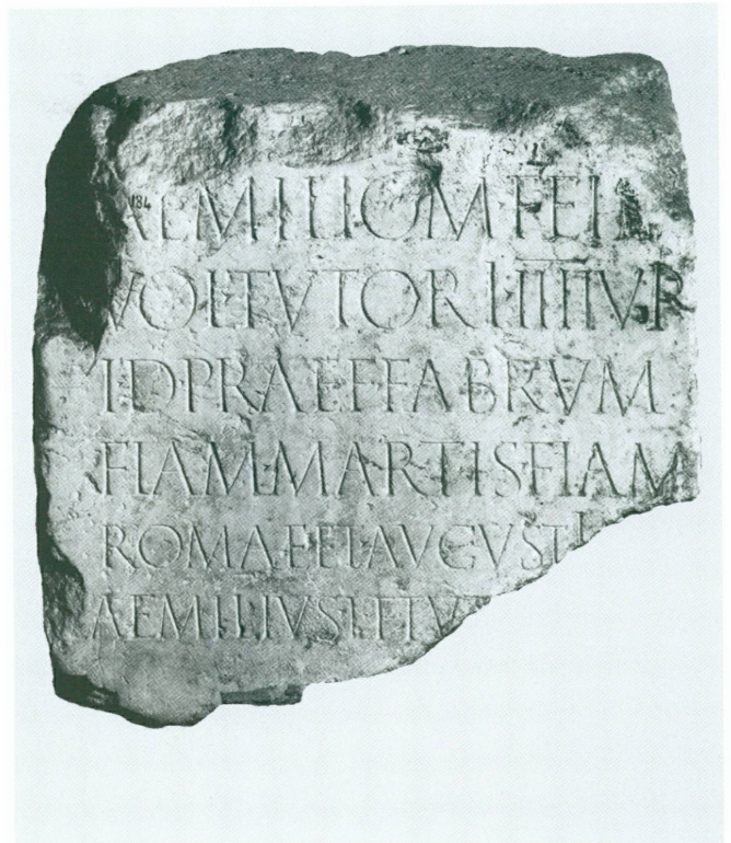
6 (à droite). Épitaphe de L. Aemilius Tutor, quattuorvir , Genève, 27 av. J.-C. – 14 ap. J.-C. | Pierre gravée, 68 × 71 × 41 cm (MAH, inv. EPI 184 [ILN, Vienne 849 (= WIBLÉ 2005, pp. 247-248)])