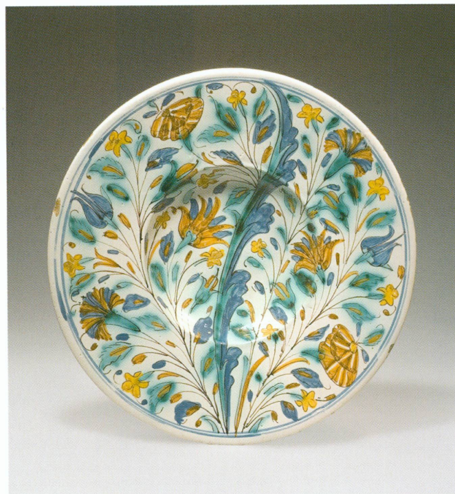
6 (à droite). Vénétie | Plat, 1650-1680 | Faïence, décor de grand feu à l'imitation du style floral d'Iznik, Ø 36 cm (MA, inv. AR 2007-222 [don Association du fonds du Musée Ariana, Genève])