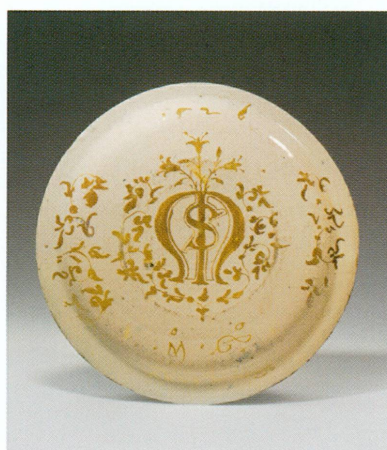
1-2. Gubbio, atelier de Maestro Giorgio Andreoli | Plat, avers ( L'Annonciation ) et revers, 1526 | Majolique, décor de grand feu et lustre, Ø 30 cm (MA, inv. AR 2007-130 [don Clare van Beusekom-Hamburger, Crans-près-Céligny])

1. Voir plus loin, pp. 203-204 et fig. 8