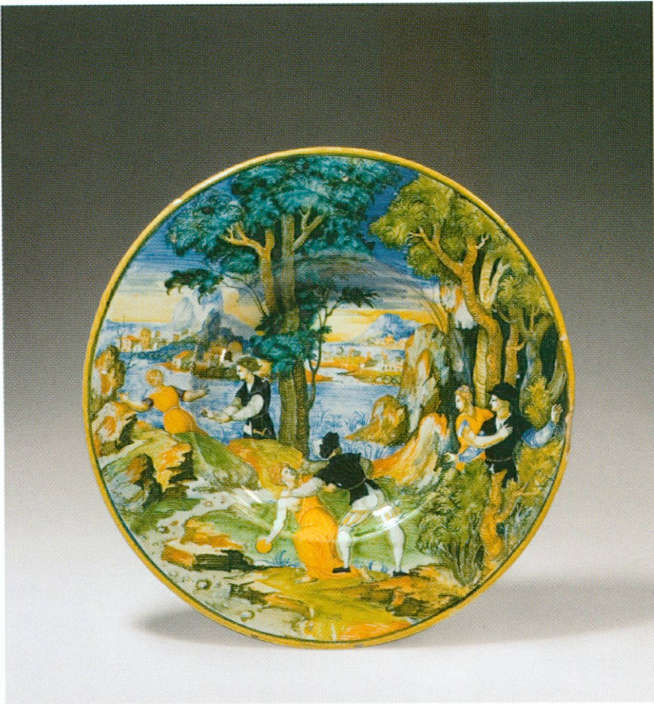
3 (à gauche). Urbino, atelier de Guido di Merlino | Tondo ( Atalante et Hippomène ), 1541 | Majolique, Ø 28,3 cm (MA, inv. AR 2007-126 [don Clare van Beusekom-Hamburger, Crans-près-Céligny])