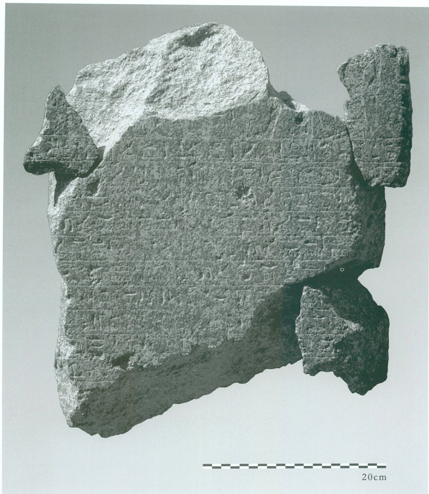
9. Fragments de la stèle de l'an III d'Aspelta