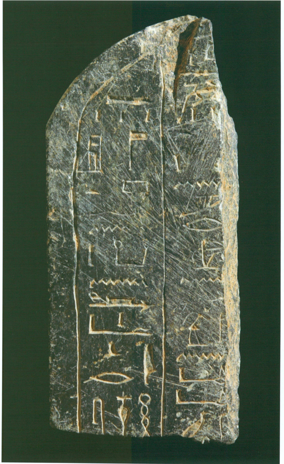
7. Partie supérieure gauche d'une stèle en békhen