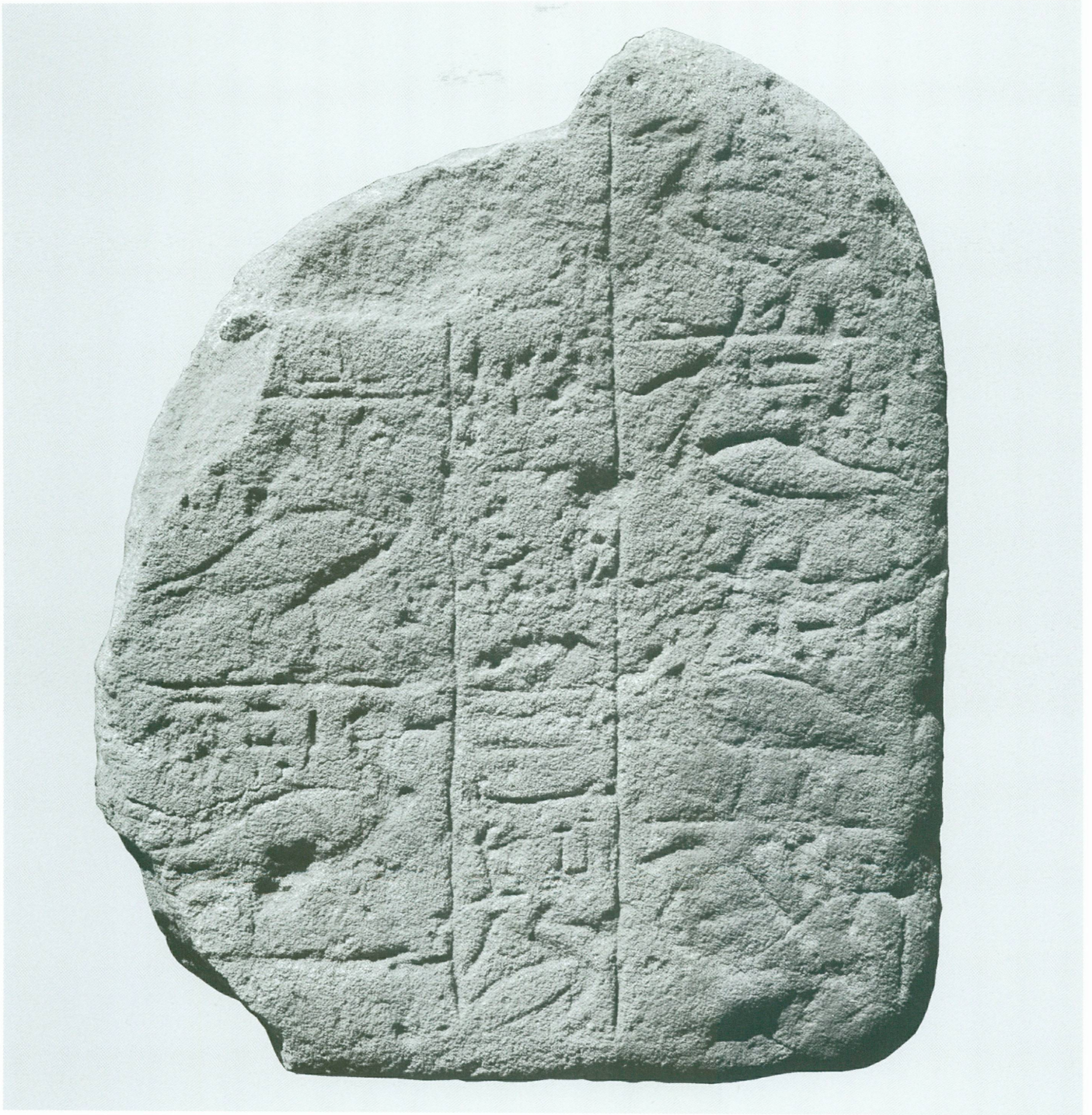
6. Stèle en grès aux oies d'Amon-rê