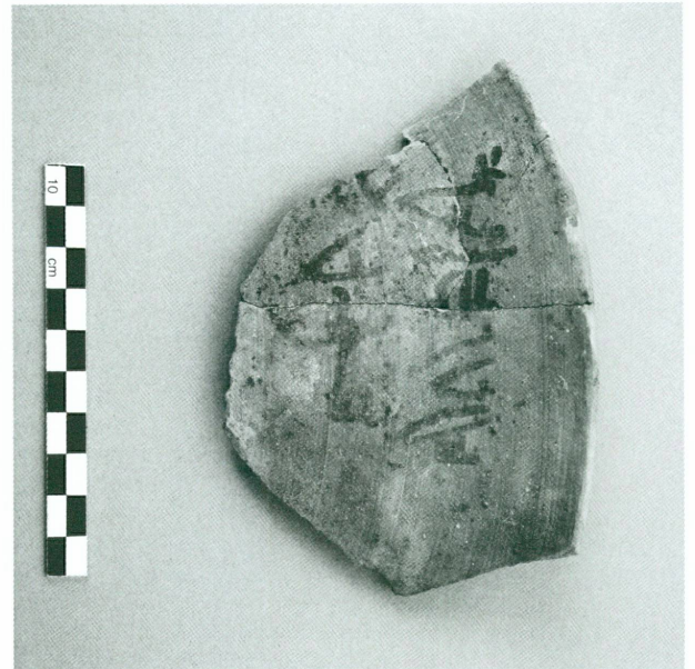
10 (en haut, à gauche). Ostracon hiéroglyphique documentaire