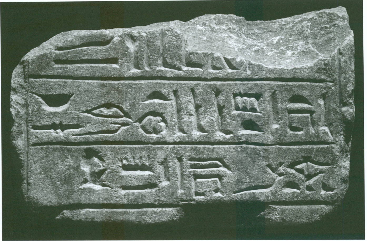
5. Partie inférieure d'une stèle en calcaire

Deux fragments de békhen inscrits pouvant appartenir au même monument proviennent également du voisinage immédiat de la porte orientale de la salle hypostyle du temple central de Thoutmosis III :