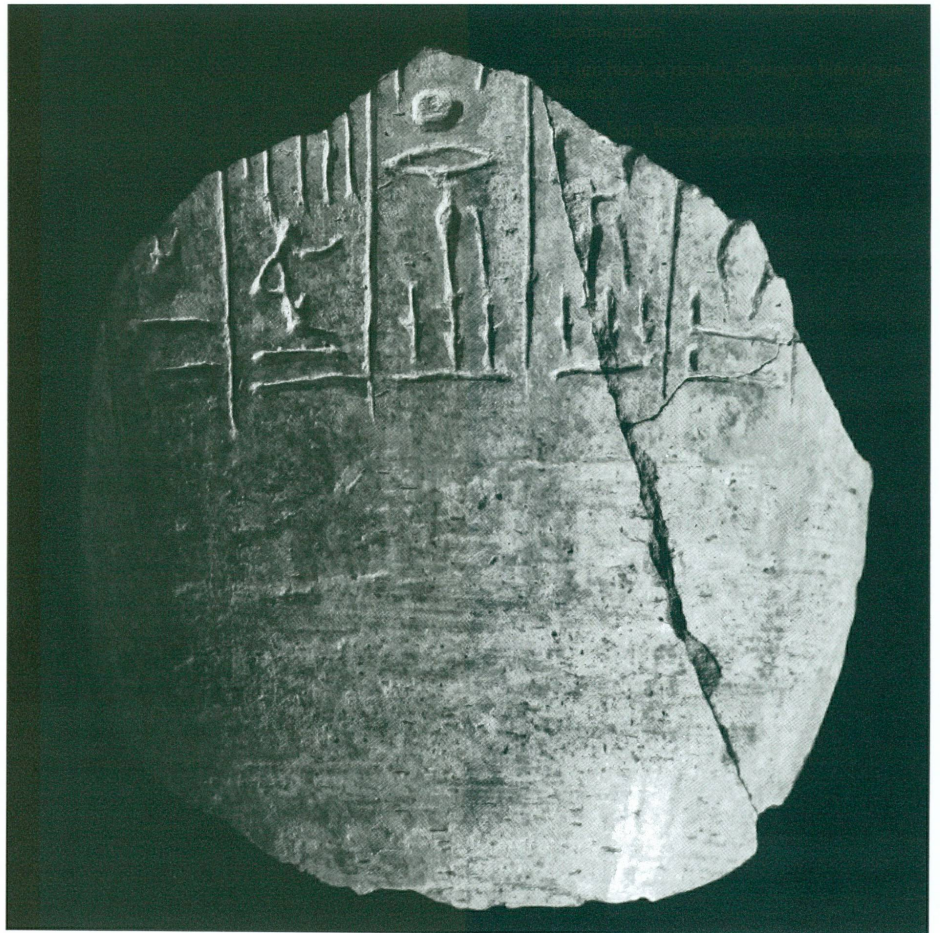
12 (en bas). Tesson provenant d'un vase canope