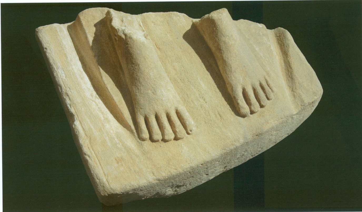
13 (en haut). Partie inférieure d'une statue d'homme assis en grès