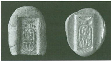
1 (en haut). Moule d'une plaquette inscrite, en forme de cartouche royal, provenance inconnue, Nouvel Empire, règne de Ramsès II, XIII e siècle av. J.-C. | Terre cuite, haut. 3,3 cm (MAH, inv. A 2008-2 [legs Friedrich Steffen, Genève, 2003])