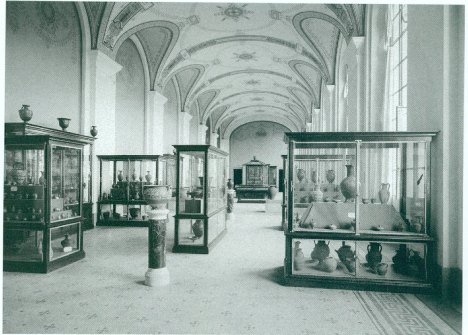
5. Salles des collections Fol et des antiquités romaines et barbares, vers 1910 | Négatif sur plaque de verre, 18 × 24 cm | Au premier plan, vases antiques des collections Fol

chaleureusement tous ceux qui, par leur appui moral ou effectif, leurs conseils ou leurs communications, m'ont aidé efficacement, m'ont encouragé dans l'œuvre que j'avais entreprise [...]» 70 . » Nulle amertume, dans les propos de Fol ; peut-on alors vraiment prétendre que l'ouverture de son Musée fut un insuccès auprès du public ? Walther Fol a certes dû être déçu – mais comme tout homme qui a foi en la valeur de son projet – de ne pas assister à un véritable enthousiasme populaire et à un vif intérêt des scientifiques pour ses collections ; néanmoins, il nous semble qu'il n'en fut ni totalement surpris ni même découragé 71 .