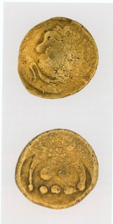
4. Statère du type Regenbogenschlüsselschen , Allemagne du Sud | Or, 7,51 g, Ø moyen 18,5 mm (MAH, inv. CdN 6846) | «[...] une monnaie gauloise en or, assez rare, qu'on estime avoir été frappée en Helvétie» ( Compte rendu de la séance du Conseil municipal , 2 octobre 1883) · LA Tour 1892, n° 9421