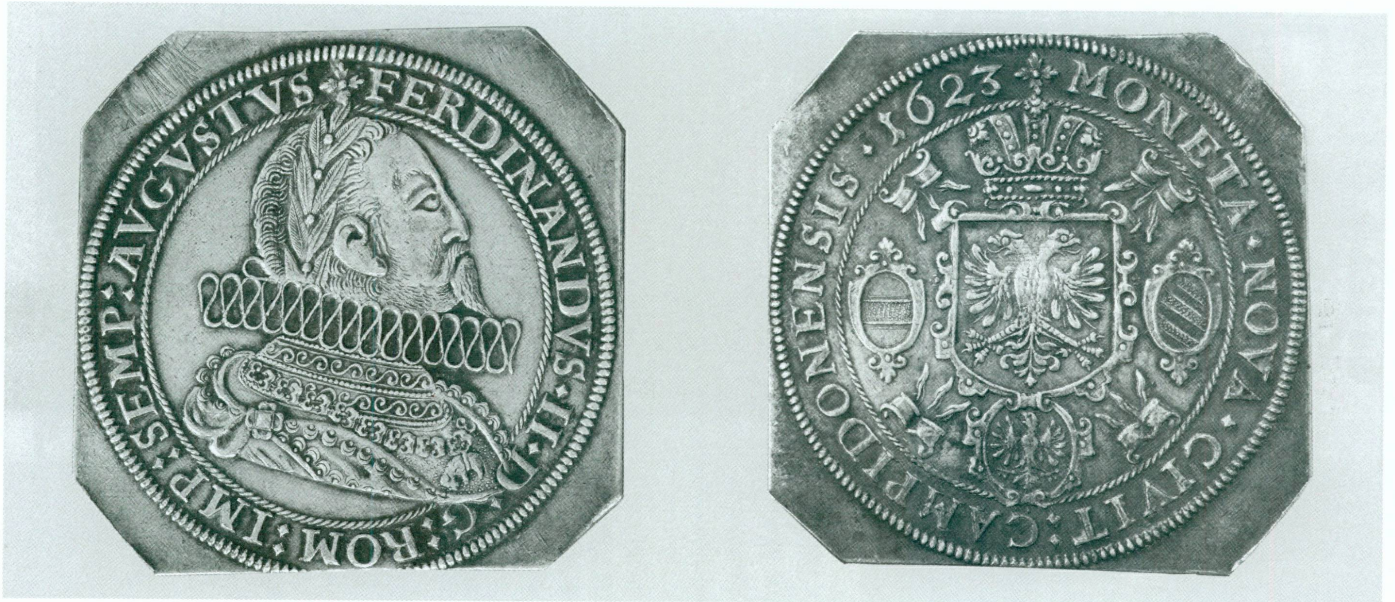
7. Kempten, Ville impériale, Klippe d'un demithaler, 1623 | Argent, 8,79 g, 36,1 × 35,1 mm (MAH, inv. CdN 19357) | « Les séries allemandes renferment des raretés de premier ordre. » ( Compte rendu de la séance du Conseil municipal , 2 octobre 1883)

celle de Walter Scott 10 sh. c. a. d. 12 francs 60. Comme je ne suis pas en fonds je ne lance pas dans ces prix, veut-il que je lui en achète quelques unes des dernières parues [...]» 21 .