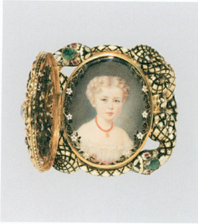
7 (à gauche). Auteur inconnu | Bracelet à petit portrait , [Genève], vers 1830-1850 | Or rose, émail champlevé, grenats, émeraudes, opale, perles, miniature à la gouache sur ivoire, haut. 6,50 cm (MAH, inv. H 2008-132 [achat])