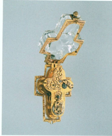
8 (au centre). Zacharie Fonnereau (France [région genevoise], vers 1600 – La Rochelle, troisième quart du XVII e siècle | Montre-croix dans son écrin d'origine (La Passion du Christ) , La Rochelle, deuxième quart du XVII e siècle | Cristal de roche, laiton gravé et doré, étui argent, haut. 4,50 × larg. 1,30 × ép. 1,50 cm (MAH, inv. H 2008-35 [achat])