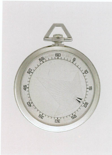
11 (à gauche). Breguet (Paris, 1775) | Montre de poche à heures sautantes et vagabondes, Paris, Genève, vers 1935 | Or blanc, cadran argent, Ø 4,57 × haut. 5,69 × ép. 0,92 cm (MAH, inv. H 2008-37 [achat])