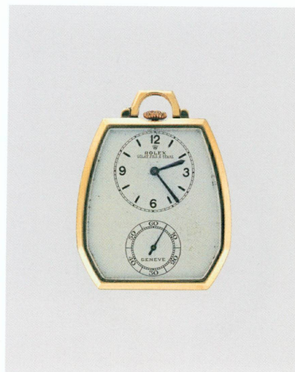
12 (au centre). Rolex (Genève, 1908), Golay Fils & Stahl (Genève, 1896) | Montre dite de smoking, Genève, vers 1940 | Or jaune, cadran sablé, argenté, émail champlévé, haut. 4,76 × larg. 3,73 × ép. 0,71 (MAH, inv. H 2008-139 [achat])