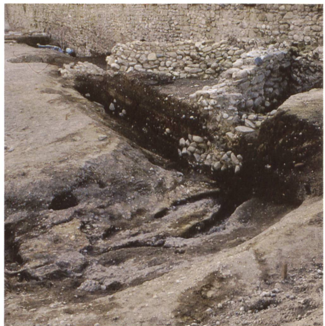
2 Le cours du ruisseau mis au jour à l'emplacement du parking de Saint-Antoine.

Les observations anciennes témoignent d'une fréquentation des lieux depuis le Néolithique (4000-2000 av. J.-C.). En se basant sur des textes médiévaux, le premier archéologue cantonal genevois, Louis Blondel, postule l'existence de trois mégalithes; deux d'entre eux sont situés à proximité de la voie des Crêts de Saint-Laurent 6 . Un quatrième (fig. 3) est apparu en 1987 lors de la fouille de la cour de l'ancienne prison. Long de 2,4 m et orné de 18 cupules, il était basculé dans le comblement d'un puissant fossé du I er siècle av. J.-C. Ces observations suggèrent la présence d'alignements mégalithiques en bordure septentrionale du plateau. Louis Blondel signale par ailleurs dans ce secteur la découverte de plusieurs objets dont la datation s'échelonne entre le Néolithique et le Hallstatt, ainsi que d'une quantité importante de céramique de La Tène finale 7 . Au sein de cet inventaire disparate, il attribue une interprétation culturelle à la mise au jour, en 1872, d'une hache de l'âge du Bronze au voisinage d'un des captages médiévaux de la source des Crêts de Saint-Laurent, située en contrebas de Saint-Antoine 8 .