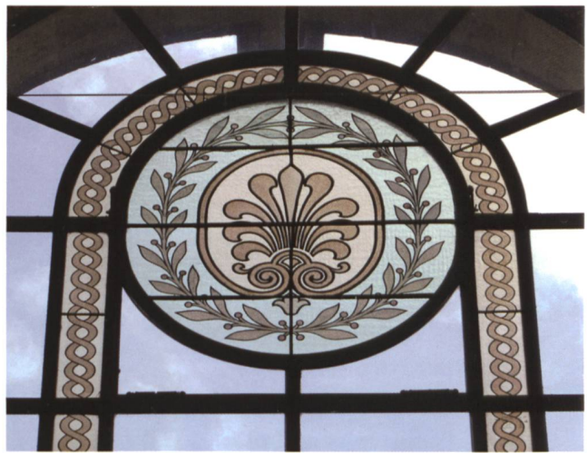
4 Vitrail, escalier central (intérieur, fenêtre axiale de l'étage supérieur), vers 1909, verre incolore peint à la grisaille et aux émaux (haut. 700 cm, larg. 400 cm).