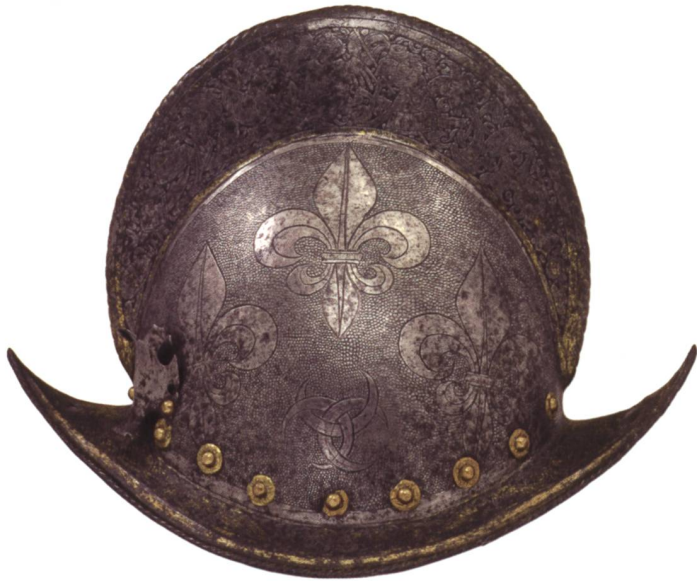
2 Morion de la garde d'Henri II, roi de France. Vers 1555, haut. 30 cm, poids 1608 gr. MAH, inv. AD 7164.

propre à chaque projet, conformément aux pratiques muséographiques contemporaines. Afin d'offrir une grande souplesse d'utilisation, ils comporteront un minimum de contraintes architecturales (piliers, cloisons fixes).