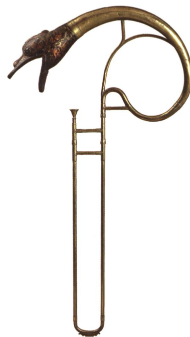
Duarry, facteur d'instruments, Buccin avec tête de dragon polychrome. Entre 1825 et 1850, Barcelone, long. 112 cm. Inv. 496.

L'instrumentarium baroque est très bien représenté : la famille des violes est au complet, avec des facteurs aussi fameux que Barak Norman ou Louis Guersan, celle des violons également avec notamment de remarquables pièces d'Allemagne du Sud sans oublier les claviers – épinette, clavecin italien du XVII e , virginal, ottavino – ni les instruments « bizarres » : trompette marine, viola pomposa, serpent. Flageolets, vielles à roue et musette témoignent du goût pour la pastorale au XVIII e siècle, tandis qu'un bel ensemble de pochettes évoque les maîtres à danser. Pour la période classique, hautbois, cor anglais, clarinettes, clavicornes et pianoforte font voyager dans toute l'Europe. Quant aux innovations techniques du XIX e siècle, elles s'illustrent notamment à