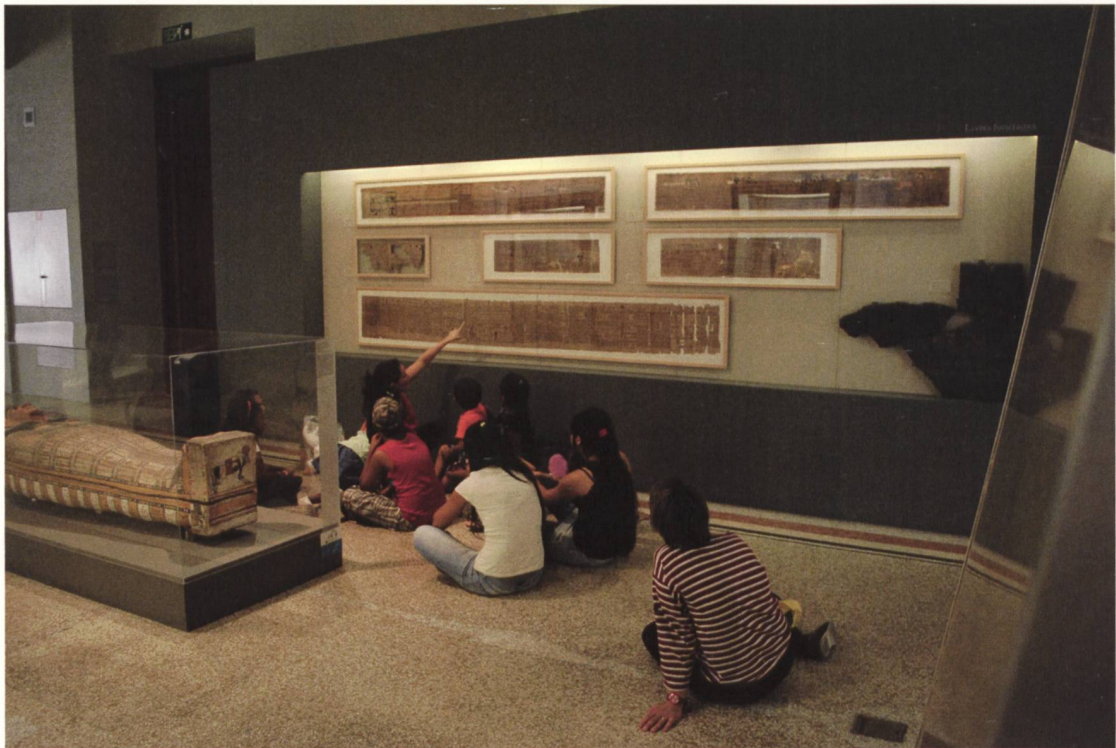
6 Une médiatrice faisant découvrir les collections d'archéologie égyptienne à un groupe d'enfants.