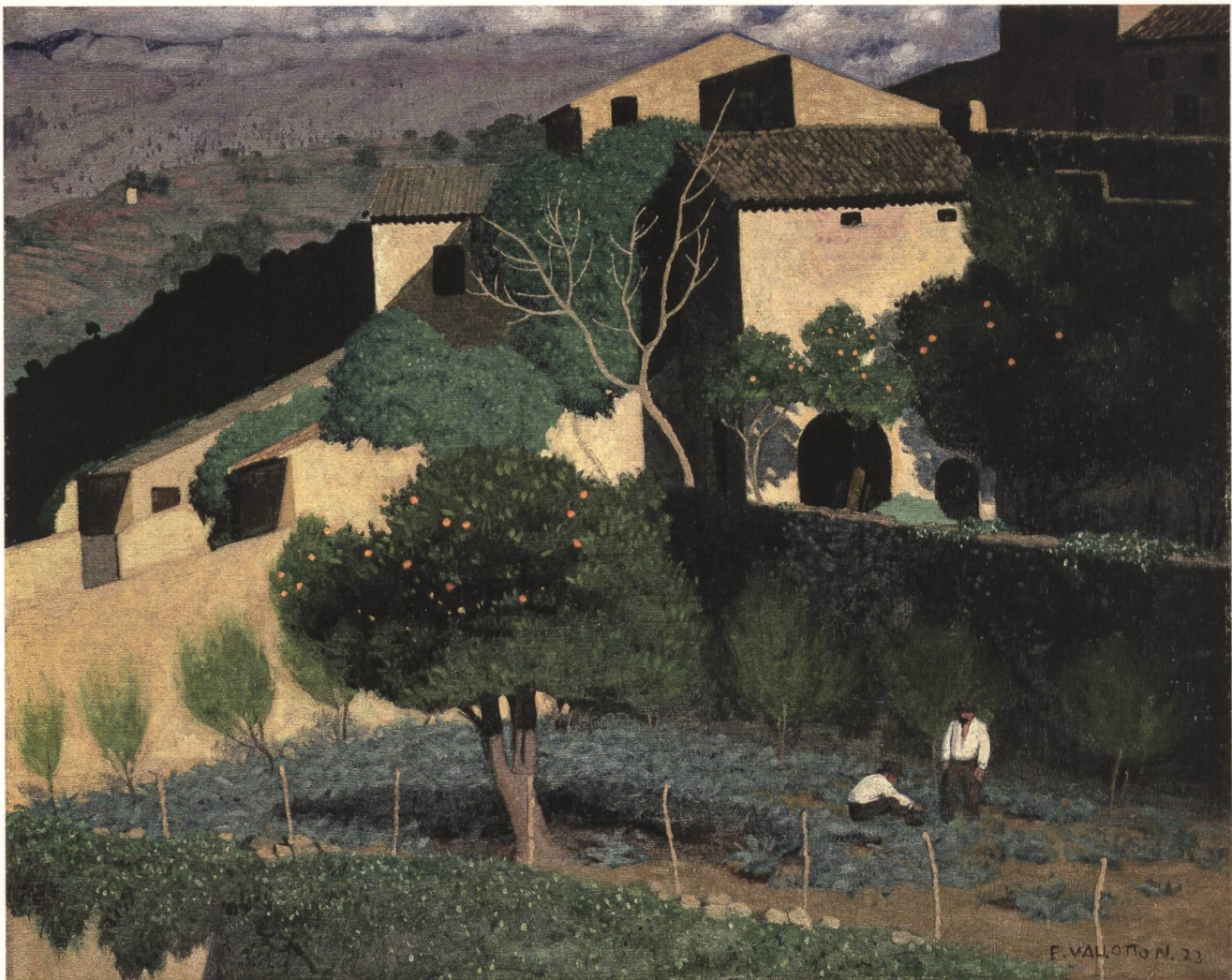
2 Félix Vallotton (Lausanne 1865 – Paris 1925), Jardins d'orangers à Cagnes , 1923-1924. Huile sur toile, 65,3 x 80,5 cm. MAH inv. 1925-55; don de la Société auxiliaire du Musée, 1925.

À cette époque, et à la différence des autres musées de Suisse, notre musée ne comptait pas encore les grandes entreprises de l'économie genevoise parmi ses mécènes 2 . Le mécénat était alors principalement d'origine privée. La situation a notablement évolué depuis, le Musée d'art et d'histoire bénéficiant aujourd'hui non seulement de la générosité de nombreux donateurs privés et fondations, mais également de celle de banques et de sociétés qui contribuent à favoriser le développement et la diversité de la vie culturelle de Genève. Face aux nouveaux défis liés notamment au financement du projet de rénovation et d'agrandissement du Musée d'art et d'histoire, nous devons nous interroger sur notre pratique du mécénat en la mettant en perspective, d'hier à aujourd'hui, dans le contexte suisse et genevois. Il n'est pas inutile pour notre propos de rappeler que le mécénat est un usage universel «entendu