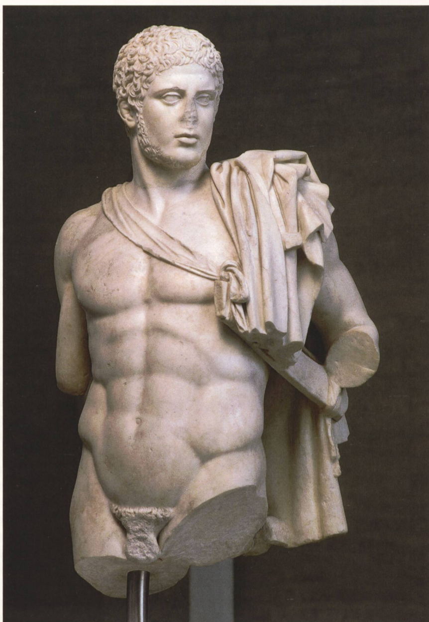
6 Diomède . Provenance inconnue, copie romaine d'un original du 3 e quart du V e s. av. J.-C. Marbre, haut. 102 cm. Munich, Glyptothèque, inv. 303.

Au vu de ce qui précède, le remplacement d'attribut sur les répliques impériales du Diomède de Crésilas trouve une explication. Le Palladion, nous l'avons vu, était conservé dans le temple de Vesta, aux côtés d'autres objets sacrés. Comme le rappelle Denys d'Halicarnasse ( Antiquités romaines II, 66, 3), ceux-ci sont : « interdits à la plupart des gens et [...] seuls les vierges et les pontifes [en] ont connaissance ». De son côté, Plutarque ( Vie de Camille , 20) parle de « choses sacrées,