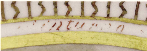
3 Détail de la fig. 2.