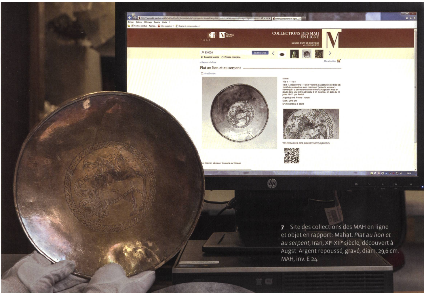
7 Site des collections des MAH en ligne et objet en rapport: Mahat. Plat au lion et au serpent , Iran, XI e -XII e siècle, découvert à Augst. Argent repoussé, gravé, diam. 29,6 cm. MAH, inv. E 24.

d'inventaire, de documentation photographique, de conservation curative et préventive, avant de regrouper toutes les collections dans un nouveau dépôt. De nombreuses autres institutions, notamment le Musée d'ethnographie de Genève, ont déjà expérimenté cette entreprise. Cela signifie traiter les objets un à un : contrôler s'ils sont déjà enregistrés informatiquement, établir leur fiche si ce n'est pas encore le cas, vérifier que les informations minimales sont saisies, effectuer une prise de vue documentaire si aucune photographie n'existe, enfin passer entre les mains des conservateurs-restaurateurs pour vérifier l'état sanitaire de l'œuvre en vue de sa maintenance. Le nombre de tâches à accomplir, multiplié par le nombre d'œuvres à traiter, donne un résultat légèrement vertigineux. Une seule constatation s'impose, il faudra aller vite!