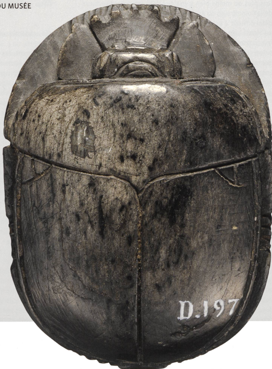
1 Scarabée de cœur inscrit du chapitre XXX B du Livre des Morts . Dos. Pierre dure noirâtre à reflets verts [?], 5,4 x 3,8 cm. MAH, inv. D 197.

L'ÉTUDE DES INVENTAIRES ANCIENS – ET CELLE DE LEUR DOCUMENTATION – PERMET BIEN SOUVENT DE RETROUVER L'ORIGINE DE QUELQUES OBJETS, VOIRE DE PLAIDER EN FAVEUR DE L'AUTHENTICITÉ DE PIÈCES CONTESTÉES. DIX PETITS (ET PLUS GROS) SCARABÉES RAPPELLENT LES ORIGINES DE LA COLLECTION ÉGYPTIENNE DU MUSÉE D'ART ET D'HISTOIRE.