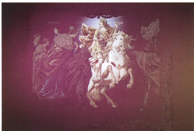
7,8 Vidéoprojection de l'exposition Héros antiques , deux séquences.