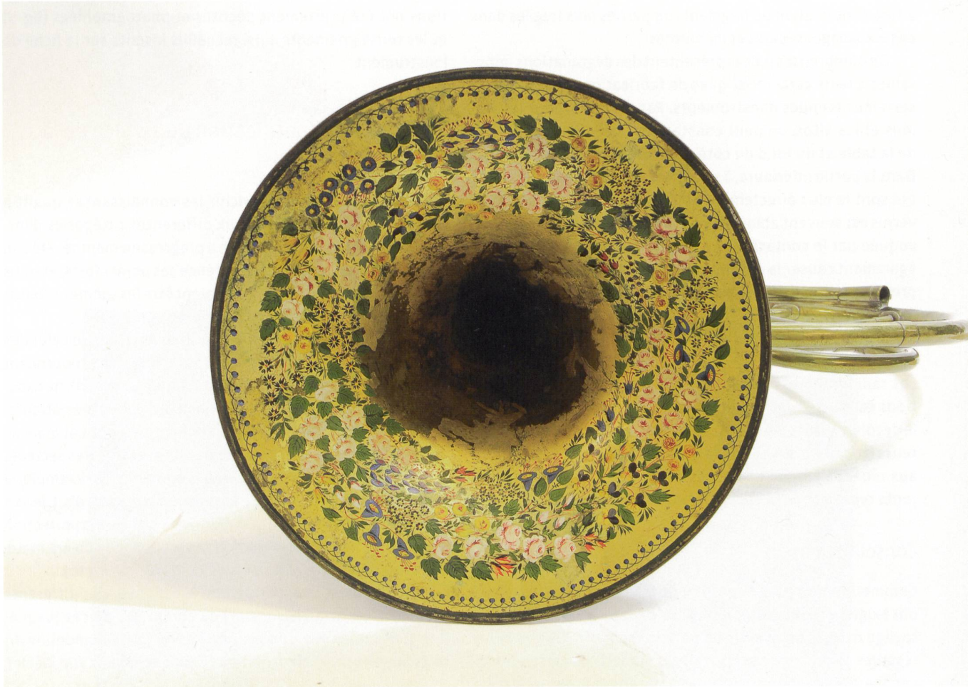
4 Pavillon peint d'un cor d'orchestre, F. Piatet & Benoit, Lyon, vers 1840. Laiton, décor polychrome à l'intérieur du pavillon, long 50 cm. MAH, inv. IM 395.

des expositions temporaires, mais aussi, et avant tout, à limiter au strict minimum la manipulation des instruments.