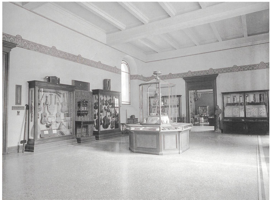
3 Les instruments de musique exposés au Musée d'art et d'histoire en 1910.

Cet aspect est important, car il souligne le souhait de contribuer à la création d'un musée de la Ville et révèle également l'attachement de la donatrice à sa collection : les conditions fixées par M me Galopin induisent clairement que les instruments devront être exposés dans les mêmes vitrines que celles dans lesquelles ils étaient conservés chez elle. Ces conditions seront respectées et, lors de l'ouverture du musée, ils furent exposés réunis dans une seule salle (fig. 3).