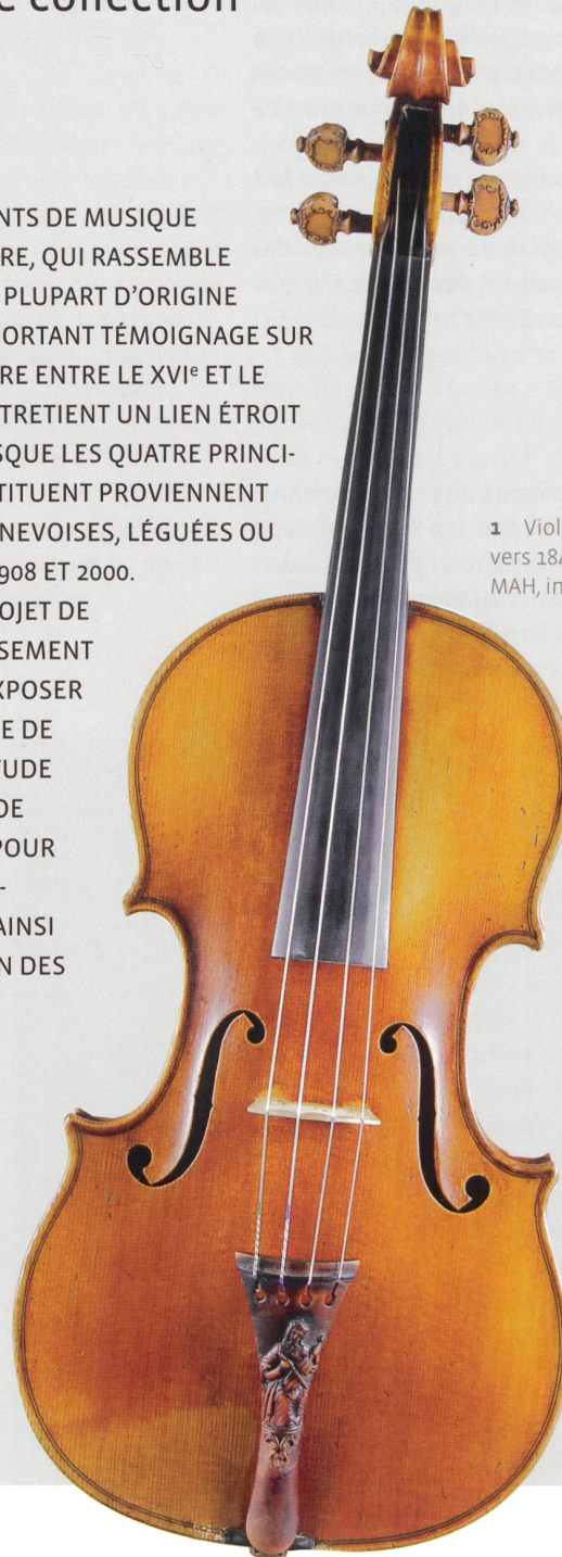
1 Violon, Jean-Baptiste Vuillaume, Paris, vers 1840. Bois d'érable, long. 60,5 cm. MAH, inv. 18403; legs Adrien Alexy.

DANS LA PERSPECTIVE DU PROJET DE RÉNOVATION ET D'AGRANDISSEMENT DU MUSÉE, QUI PRÉVOIT D'EXPOSER UNE PARTIE DE CET ENSEMBLE DE FAÇON PERMANENTE, UNE ÉTUDE PRÉLIMINAIRE A ÉTÉ MENÉE DE NOVEMBRE 2013 À MAI 2014 POUR ÉVALUER SON INTÉRÊT HISTORIQUE ET ORGANOLOGIQUE, AINSI QUE L'ÉTAT DE CONSERVATION DES INSTRUMENTS.