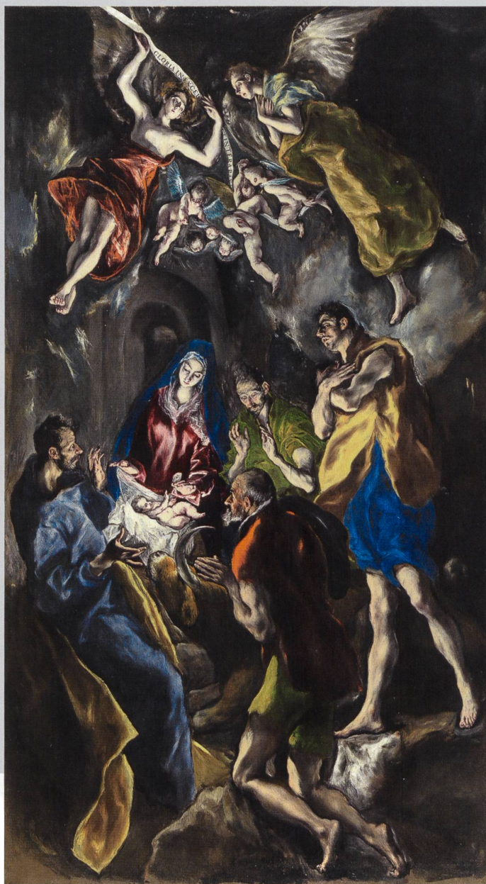
1 El Greco (Candie/Crète, 1541 – Tolède, 1614), Adoration des bergers , 1612-1614. Huile sur toile, 319 x 180 cm. Madrid, Museo Nacional del Prado, inv. P 2988.