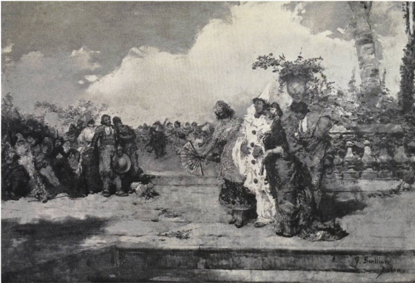
4 José Benlliure y Gil (Valencia, 1858-1937), Carnaval à Rome , vers 1881. Huile sur toile, 120 x 180 cm. Localisation inconnue. Reproduit dans Christie's cat. de vente Londres, 15 juillet 1955.