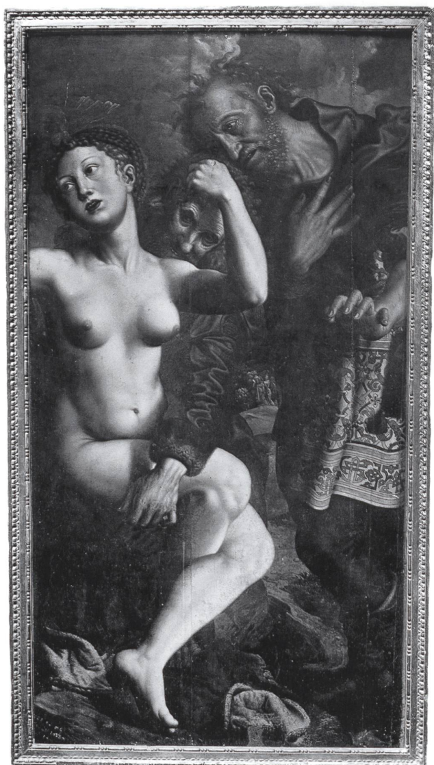
6 Jan van Hemessen (Hemiksem, vers 1500 – Haarlem, vers 1566), Suzanne et les vieillards , 1543. Huile sur bois, 140 x 75 cm. Localisation inconnue.

de sept tableaux de sa collection, dont le Saint François de Zurbarán (fig. 3). Nos requêtes adressées aux musées allemands et autrichiens n'ont pas donné de résultats. Ni les musées de Munich, ni ceux de Cologne ne gardent de traces d'un contact avec Losbichler. À l'Albertina à Vienne, le nom de Losbichler n'est pas connu ; il ne l'est pas non plus au Bureau de la Commission pour la recherche de provenance ( Büro der Kommission für Provenienzforschung beim Bundeskanzleramt ). Seule la Österreichische Galerie confirme qu'entre 1955 et 1965 Losbichler a proposé plusieurs œuvres, dont un tableau de Josef Hickel (1736-1807), propriété d'un ami à Madrid, et une Vierge à l'enfant de Leopold Bara (1846-1911).