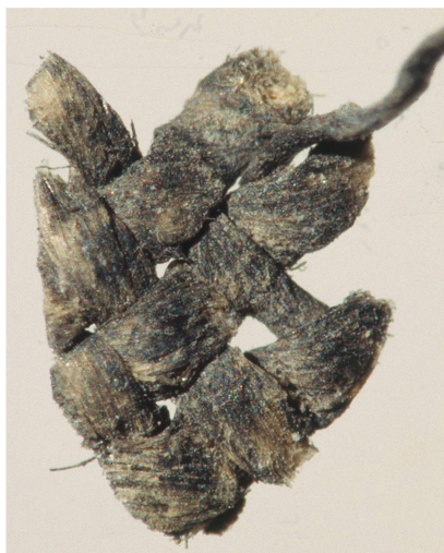
4 Détail du tissage et des fils imprimés (diam. 0,3-0,6 mm) de l'un des fragments genevois.

environ pour le lé central. Cette dimension ne correspond à aucune mesure ancienne connue. Malgré le mauvais état du support, les couleurs conservent une certaine intensité, sans doute due au choix des matériaux constitutifs.