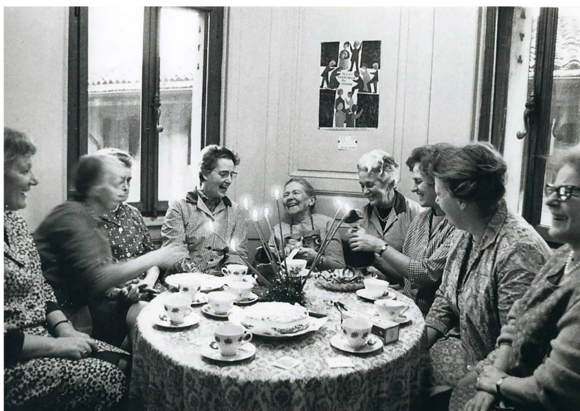
8 L'équipe du vestiaire du Centre social protestant en réunion conviviale dans la tourelle de la Maison Tavel, vers 1965 (?).