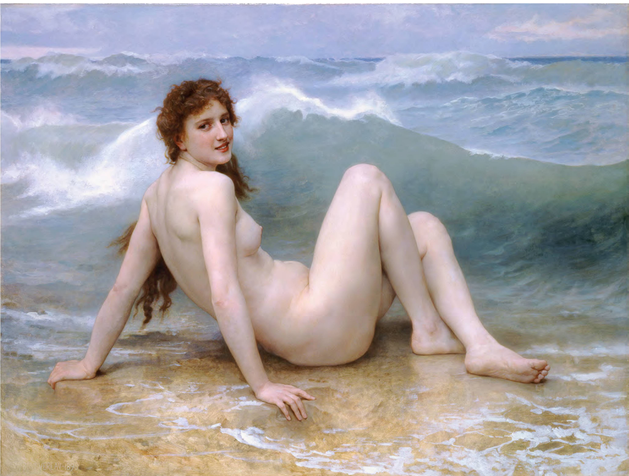
5 William-Adolphe Bouguereau (La Rochelle, 1825-1905), La Vague , 1896. Huile sur toile, 121 x 160,5 cm. Collection privée.