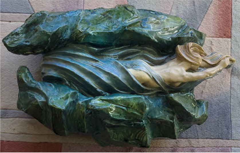
4 James Vibert (Carouge, 1872 – Plan-les-Ouates, 1942), Naiade , vers 1900. Céramique émaillée, 61 x 40 cm. Collection privée.