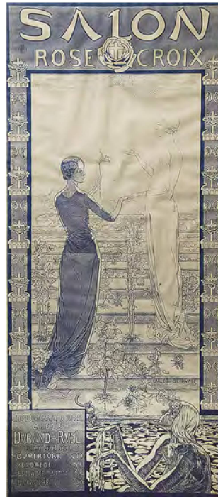
8 Carlos Schwabe, Spleen et Idéal , 1907. Technique mixte, 28 x 20,5 cm. Collection privée.