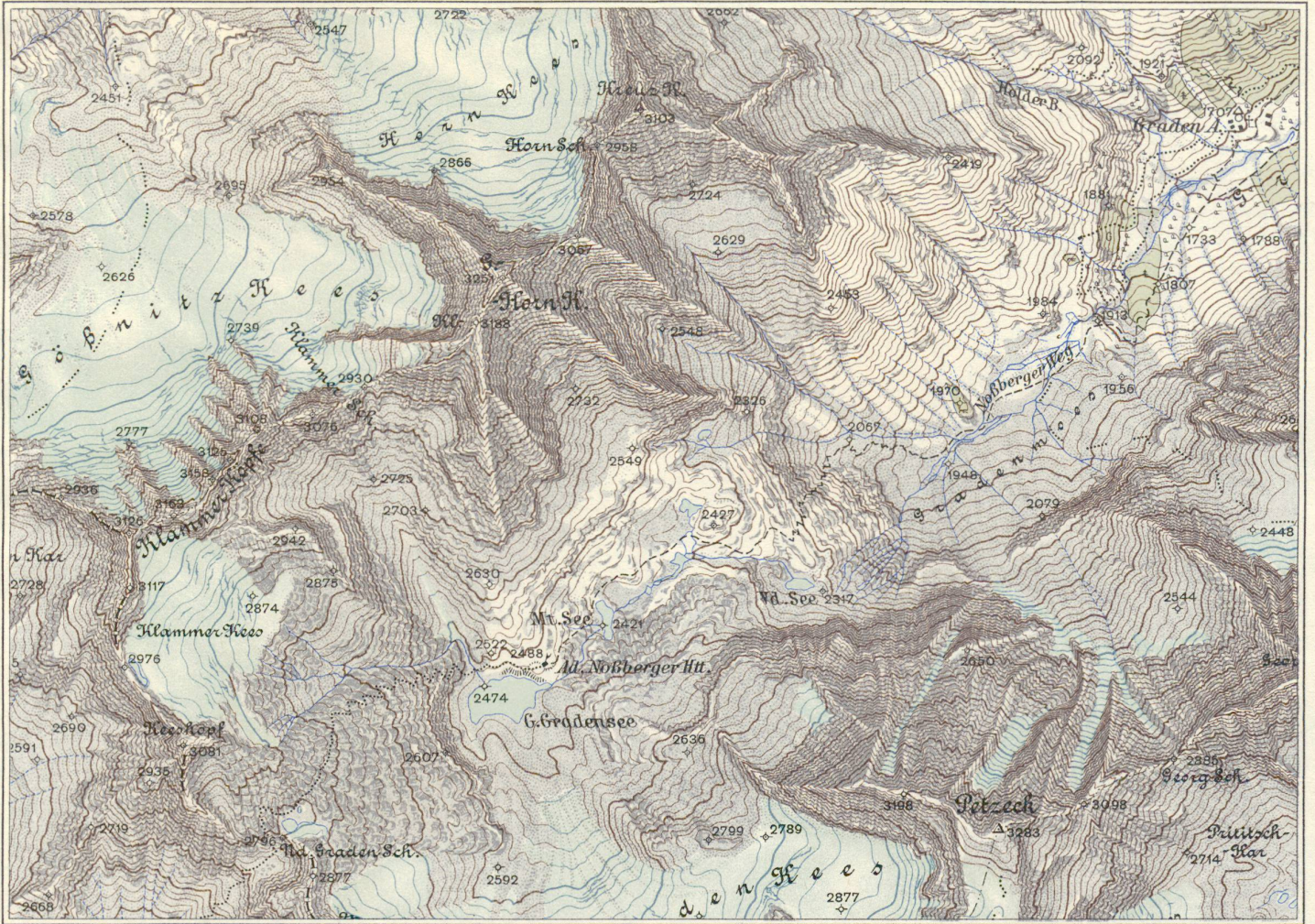
Ausschnitt aus: Österreichische Karte 1:25.000 Blatt 5249 Ost, Aufnahmeblatt 2 GRADEN ALPE

Kartographisches, früher Militärgeographisches Institut in Wien