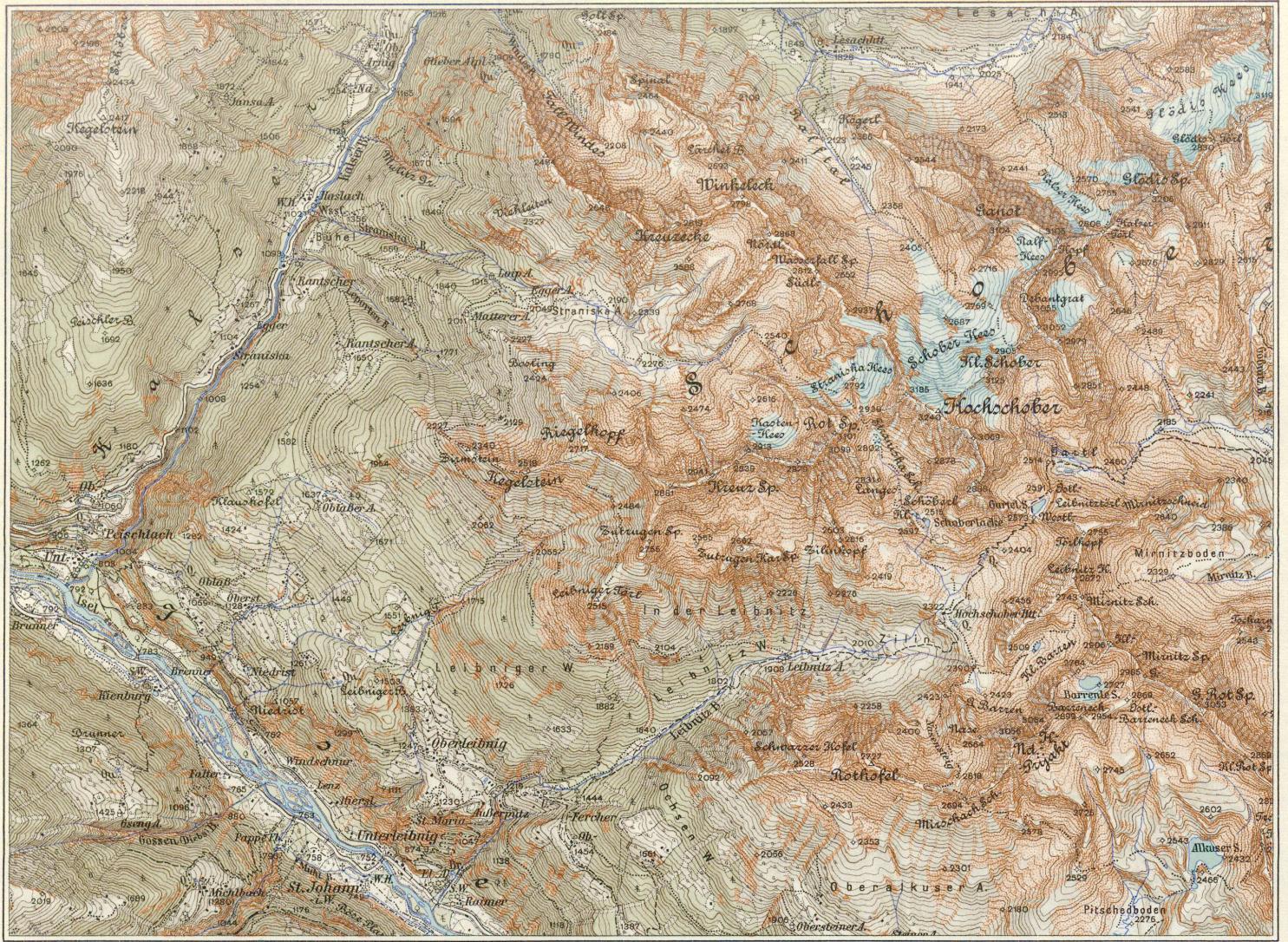
Ausschnitt aus: Österreichische Karte 1:50.000 Blatt 5249 Ost, LIENZ

Kartographisches, früher Militäreographisches Institut in Wien