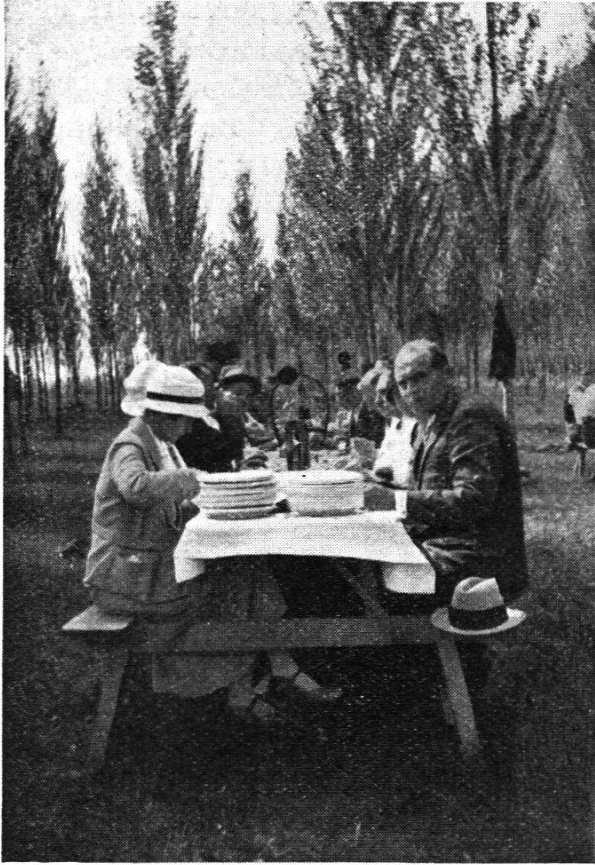
Râclette à la Sarvaz.