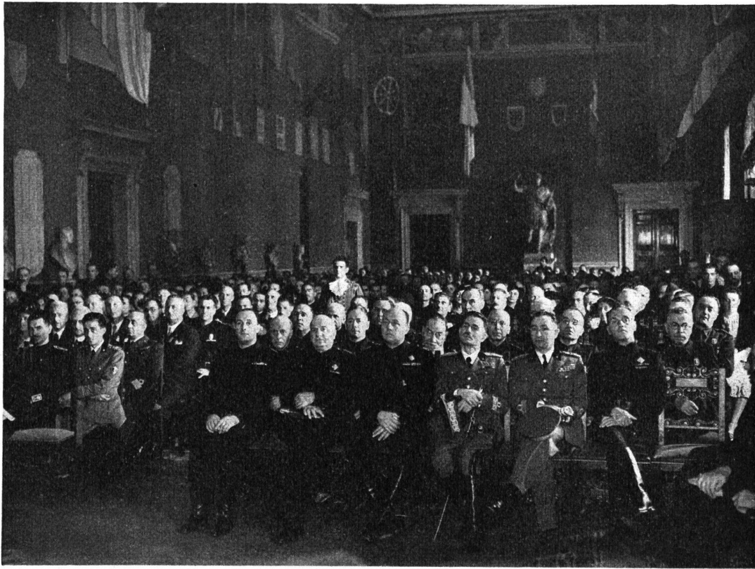
Assemblée d'inauguration du Congrès au Capitole (Salle Jules César).