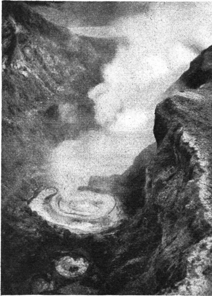
Le Solfatara près de Naples appelé aussi « Petit Vésuve ».

Au milieu de la nuit de nombreux touristes montent sur le pont, pour admirer les lumières de Messine, c'est à croire que Messine est en fête et l'effet, dans la nuit, est féérique. De nombreux phares sillonnent la mer.