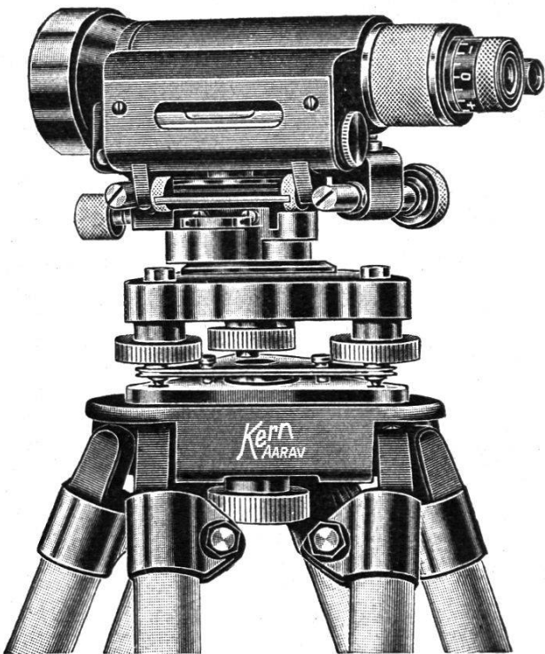
\frac{1}{3} nat. Größe

INHALTSANGABE: Die Entstehung des Übersichtsplanes, seine Nachführung und seine heutige Durchführung. Von E. Leupin, Grundbuchgeometer. — Historische Kupferstichkarten in Schraffenmanier. Von W. Kreisel, Ingenieur der Eidg. Landestopographie. — Hauptversammlung 1940 der Sektion Ostschweiz. — Buchbesprechung.