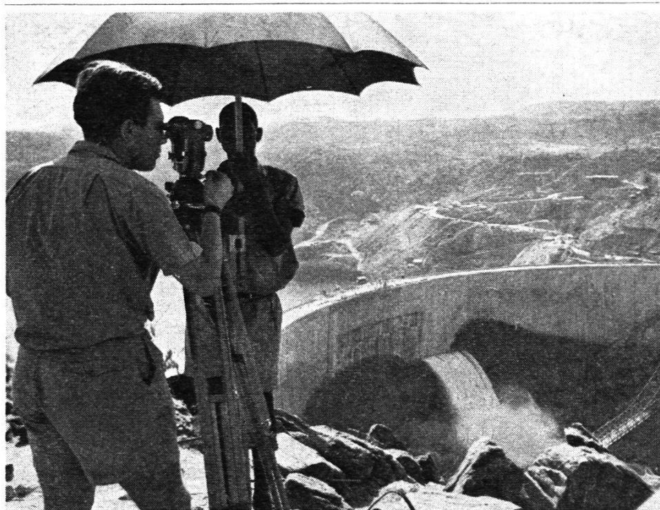
Universal-Theodolit Wild T2

Nach jahrelanger Arbeit wurde der gewaltige Kariba-Staudamm des Sambesi in Nordrhodesien fertiggestellt, womit eine erste Etappe in einem der grössten Bauprojekte der Erde beendet ist. Die mit der Planung beauftragten Ingenieure benützten für ihre Präzisionsmessungen Wild-Instrumente.