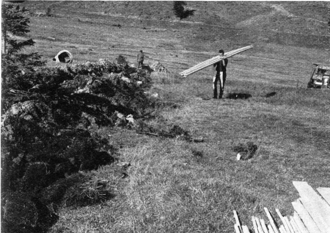
Abb. 4. Einbau von K-Drainrohren beim Alpdraineurkurs 1961 auf Tannenboden/Flums

artige Untersuchungen dürften gegenüber möglichen Einsparungen äußerst gering sein.