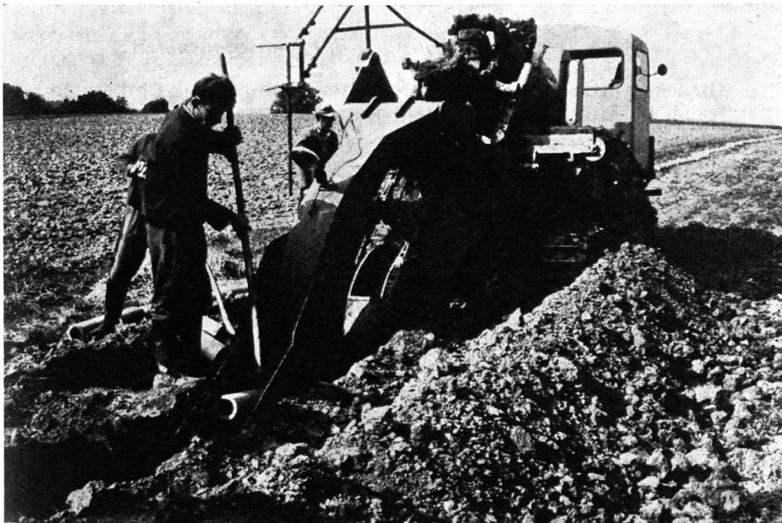
Abb. 2. Mechanisierte Tonröhrendrainung. Erfordert einen Verlegefachmann neben dem Maschinisten und Hilfskräfte

In der Schweiz wurde bisher nur Tonröhren- und in geeigneten Böden Maulwurfdrainung angewendet. Die Mechanisierung beschränkt sich auf das Baggern der Gräben und die Molepflüge. Im Hügel- und Bergland wurde und wird noch vielfach von Hand gedraint. Die großflächigen Entwässerungsgebiete, wie Linth-, Orbe-, Rhoneebene und Rheintal, sind weitgehend entwässert.