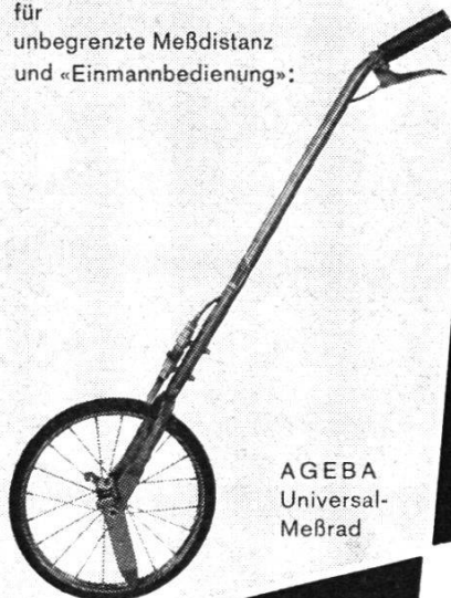
AGEBA Universal- Meßrad

für unbegrenzte Meßdistanz und «Einmannbedienung»: