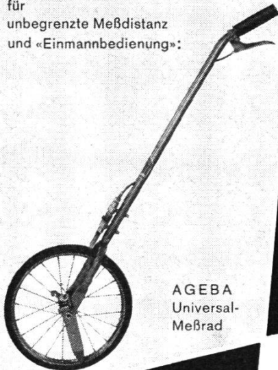
AGEBA Universal- Meßrad

für unbegrenzte Meßdistanz und «Einmannbedienung»: